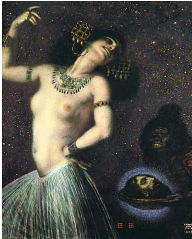
Imagem 2 - Franz von Stuck. Salome , c. 1906. 115,5 × 62,5 cm. Städtische Galerie im Lenbachhaus.