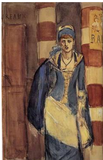
Imagem 4 - Félicien Rops. La buveuse d'absinthe , 1870. Coleção particular. (paru dans la revue la Plume en 1896)

O que mais deve ter agradado Bernardelli em tais obras é a marca constante do pessimismo fin-de-siècle, que dizia, de forma um tanto sarcástica, que a experiência dos prazeres efêmeros desembocavam na morte, - idéia, como veremos, claramente presente em Messalina .