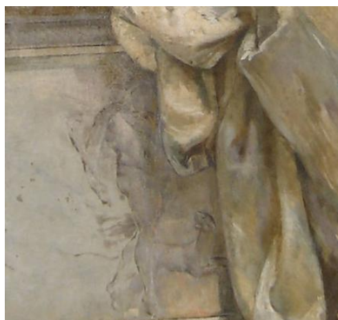
Imagem 8 - Detalhe de Messalina .

O braço de Messalina não tomba, ele está estendido, o ambiente que a cerca não é o de uma tragédia de morte, no entanto, se repararmos bem, Henrique não se limita ao ‘motivo do braço’, a idéia da morte é reforçada de outra forma. A parte superior do corpo de Messalina está ligeiramente voltada ao observador, sendo possível ver o antebraço esquerdo, dados em comum com as obras anteriormente citadas. Somente relaxando ou no momento mori ? Não sabemos, mas sem sombra de dúvida o quadro, de forma bastante hábil, mas também sutil, nos induz a este questionamento.