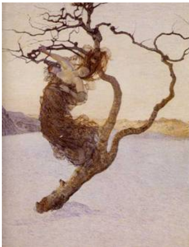
Imagem 3 - Giovanni Segantini. Le cattive Madri , 1894. Vienna Kunsthistorisches Museum.(detalhe)

malicioso, horrível, inferior, vinculado a todas as degradações físicas e morais relacionadas aos sentidos (CAVALLIN, 2002).