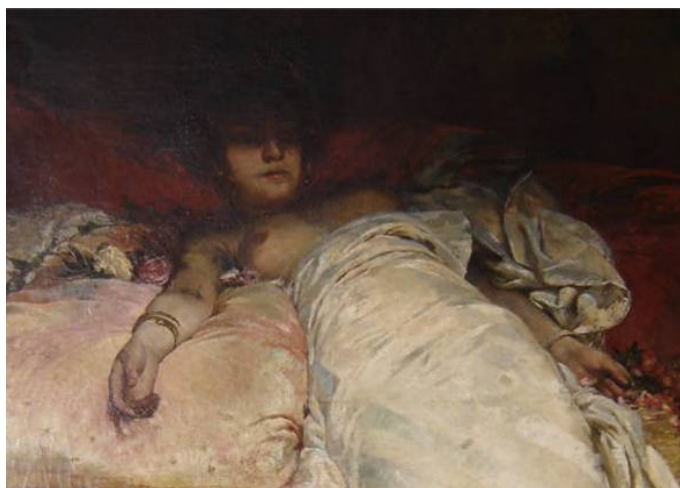
Imagem 5 - Detalhe de Messalina.

finais do século XIX, está eminentemente presente na personagem de Messalina, é essa a principal característica que, acreditamos, Henrique Bernardelli tentou passar em sua tela, sobretudo através da pose que escolheu para representá-la. Bastante ambígua, a primeira vista a pintura nos apresenta uma mulher reclinada sobre almofadas, como se ali tivesse tombado para relaxar, satisfeita e exausta após o ato sexual, deleitando-se com o momento que se segue ao gozo. Mas o arquétipo da Messalina não implica a insaciabilidade? De fato, há algo na sua postura que intriga, um certo abandono, algo de inanimado, que nos faz pensar em um corpo que não é mais senhor de si, que se encontra em um estado de não-existência. Mas a pose de Messalina não se deve a um feliz acaso por parte do artista, ela encontra uma longa tradição na iconografia européia.