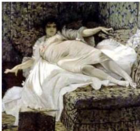
Imagem 4 - Francesco Mosso. La femme de Claude , 1878. Galleria Civica d'Arte Moderna di Torino. (título original em francês).

O que mais deve ter agradado Bernardelli em tais obras é a marca constante do pessimismo fin-de-siècle, que dizia, de forma um tanto sarcástica, que a experiência dos prazeres efêmeros desembocavam na morte, - idéia, como veremos, claramente presente em Messalina .