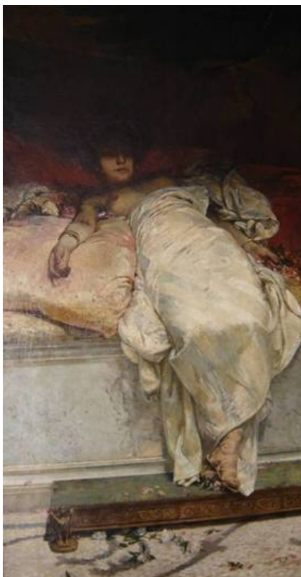
Imagem 1 - Henrique Bernardelli. Messalina . c. 1891. Museu Nacional de Belas Artes.

Prêmio de Viagem ao estrangeiro em 1878, perdendo, em um concurso bastante polêmico, para Rodolpho Amoedo. O artista segue assim mesmo para a Itália por conta própria, em 1879, permanecendo naquele país até 1888, quando retorna ao Rio de Janeiro. No entanto, após uma pesquisa atenta as fontes da época 3 , nos parece muito pouco provável que a obra tenha sido realizada na década de 1880, como consta na historiografia tradicional.