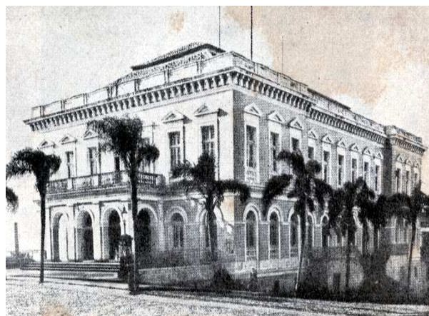
5 – Aspecto externo do Teatro São Pedro, de Porto Alegre, nos finais do século XIX.

Diferentemente dos teatros de Rio Grande e de Pelotas, o São Pedro, construído décadas mais tarde, já apresentava originalmente galerias aos populares. Se é bem verdade o caráter elitista do Sete de Abril e do Sete de Setembro, devo lembrar que o desenvolvimento urbano - com a industrialização, a imigração, a abolição da escravatura, o surgimento do proletariado, o crescimento da classe média urbana - alterou esta situação e esses teatros passaram a dispensar maior atenção às camadas populares. Esses fenômenos criaram uma nova dinâmica social que determinou a reorganização espacial dos seletos teatros burgueses da década de 1830. Explica-se assim o surgimento, nesses teatros, de galerias ou “poleiros” adaptados ao poder pecuniário das massas. A segunda metade do século XIX foi então marcada por um maior acesso das camadas menos favorecidas a essas casas de espetáculos. Neste período surgiram também no RS vários teatros voltados particularmente ao grande público.