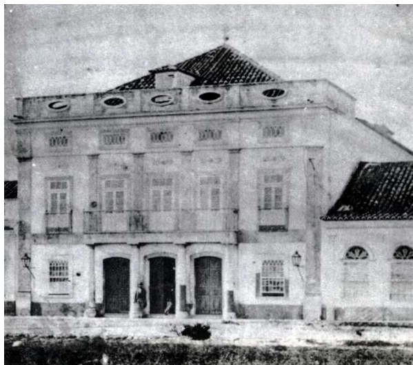
3 – Fotografia da fachada do Teatro Sete de Abril, de Pelotas, em 1875. Teatro Sete de Abril. Pelotas: Fundapel, p. 31.

Assim como aconteceu em Rio Grande, foi a elite da cidade enriquecida pela indústria do charque, e não os cofres públicos, quem financiou o teatro. Sua construção deu-se igualmente a partir da constituição de uma sociedade particular, formada em 1831. Esta instituição, por meio da venda de títulos acionários, comprou um terreno no perímetro central da cidade (em face da atual Praça Coronel Pedro Osório) e fez erguer o prédio. O estilo de sua fachada era também transitório, marcando a passagem do luso-brasileiro ao classicismo, fenômeno este observado na arquitetura civil dos principais edifícios públicos brasileiros construídos após a introdução do novo modelo francês no país, em 1816. Internamente, apresentava uma estrutura tradicional à italiana. Diferentemente do Sete de Setembro, de Rio Grande, o teatro pelotense já possuía, originalmente, espaços internos destinados à vida social que permitiam o circular do público nos intervalos dos espetáculos e garantiam assim as sociabilidades.