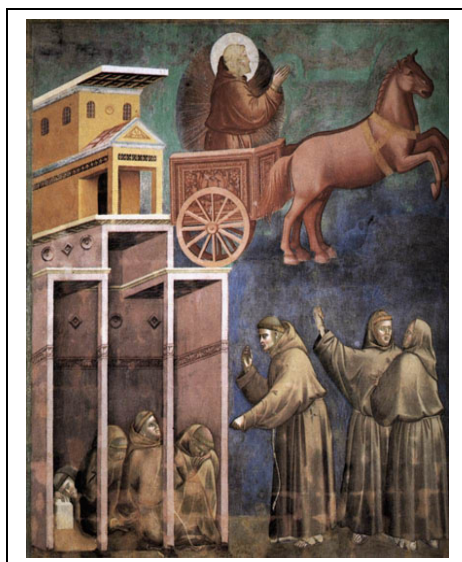
Fig. 3 - Giotto da Bondone, Legenda de São Francisco, Oitava Cena: Visão do Carro de Fogo, 1297-1299. Afresco em painel de parede lateral; 270 X 230 cm; nave central da Basílica Superior de São Francisco, Assis, Itália.

Frade Menor ou Clarissa conhece o episódio da vida de São Francisco a que, muito provavelmente, se refere a pintura da Casa de Exercícios do Convento de Santo Antônio: sua primeira representação pictórica conhecida foi feita pouco mais de setenta anos após a morte do fundador da Ordem Seráfica, ainda no século XIII, por Giotto, em um dos afrescos laterais da nave central da Basílica Superior de Assis, na Úmbria.