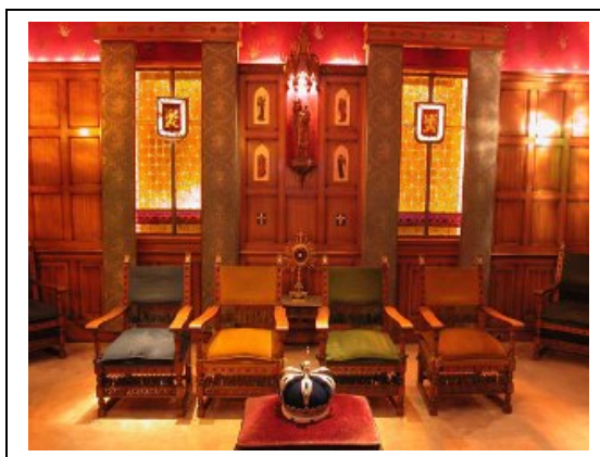
Figura 1 - Sala de reuniões da sede da Presidência e do Conselho Nacional da TFP.