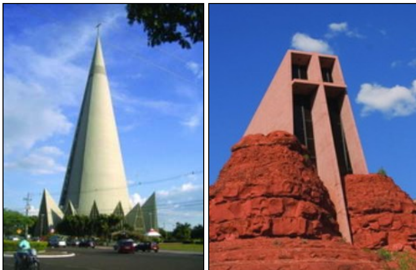
Figura 4 – Igrejas modernas, “feias como o pecado” Disponível em: http://www.catolicismo.com.br/

Finalizando esta breve e inicial análise, destacamos que o discurso tefepista preconiza que não apenas os ambientes, mas também gestos, postura, aparência, comportamento, discurso, simbologia, religiosidade, vivência, etc., devem refletir ou ser moldados para a luta entre o bem e o mal, entre a revolução igualitária e pagã e a contra-revolução católica. Nesta direção, além do testemunho de egressos, também as análises de Ubiratan Macedo e outros pesquisadores dão conta de que é característica da própria mensagem da TFP a preocupação exacerbada de que “ambientes, costumes, roupas, estilos de vida e modas transparecem opções políticas. Daí sua insistência em denunciar roupas, costumes socializantes e recomendar a seus membros trajes conservadores, cortes de cabelo ortodoxos e atitudes impregnadas de hierarquia e ordem” (MACEDO, 1979:240).