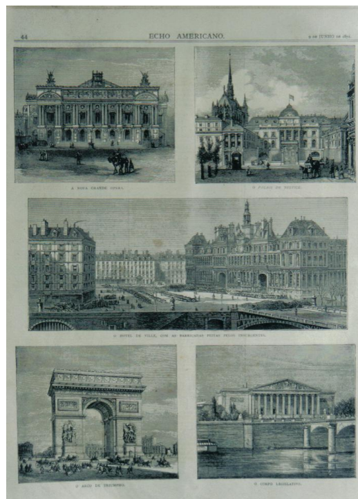
Imagem 2 - Obras da arquitetura europeia.

O Echo Americano trazia como proposta a difusão de um projeto civilizador no Brasil, cujas bases estavam alicerçadas na cultura europeia ao mesmo tempo em que reivindicava a modernidade do país. A modernidade só seria conquistada através da educação, saneamento, melhoria dos transportes, projetos na área do urbanismo, construção bibliotecas e fundação de Institutos de Pesquisa. Essas eram consideradas, segundo os articulistas do jornal, as premissas básicas para o país ser civilizado.