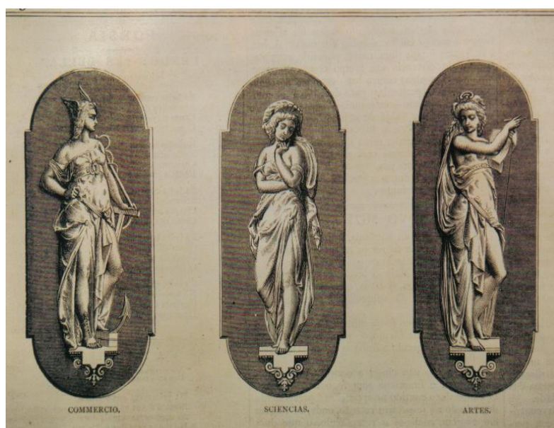
Figura 1- Alegorias do Comércio, Ciências e Artes.

Dentre as muitas imagens, e dos mais variados temas que o jornal reproduzia, encontramos as alegorias do comércio, das ciências e das artes, que fazem de maneira figurativa a representação dos temas centrais da modernização proposta pelo Echo Americano para o Império Brasileiro. 3