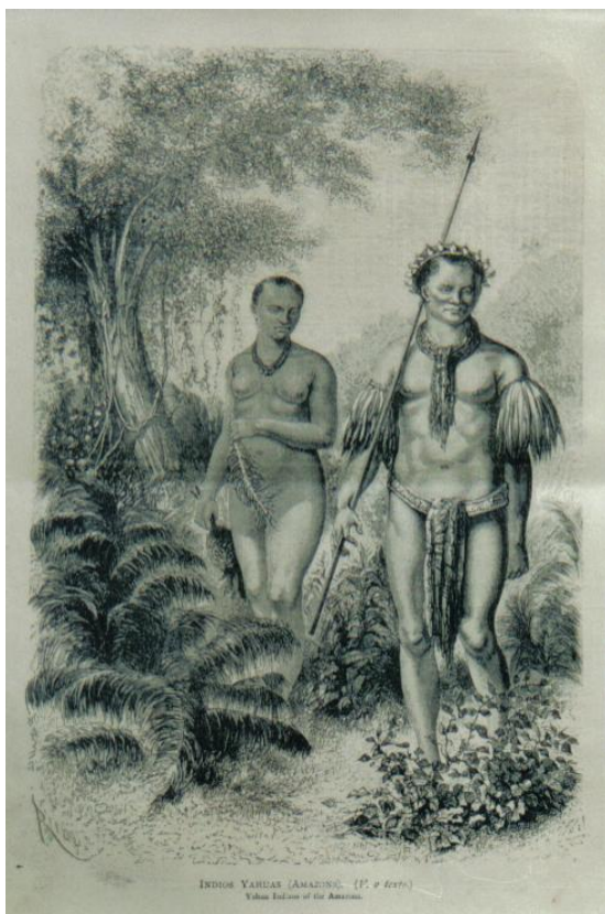
Figura 5 - Índios Coroás ou Kaingang e Yahuas, Amazonas

Seguindo esse raciocínio, a capa da terceira edição mostra os índios coroás ou kaingang, como hoje são conhecidos. Assim, são retratados com roupas impostas pela cultura do homem branco “civilizado”. Andar nu, segundo a visão do civilizador, era um ato de selvageria. Portanto, era natural que o jornal valorize o aldeamento e a aculturação dos indígenas, pois essa proposta visava uma melhoria de vida para estes povos “não civilizados”. Ao mesmo tempo em que em outra edição apresentava outra imagem sob a ótica do europeu, ou seja, a partir de uma visão idealizada.