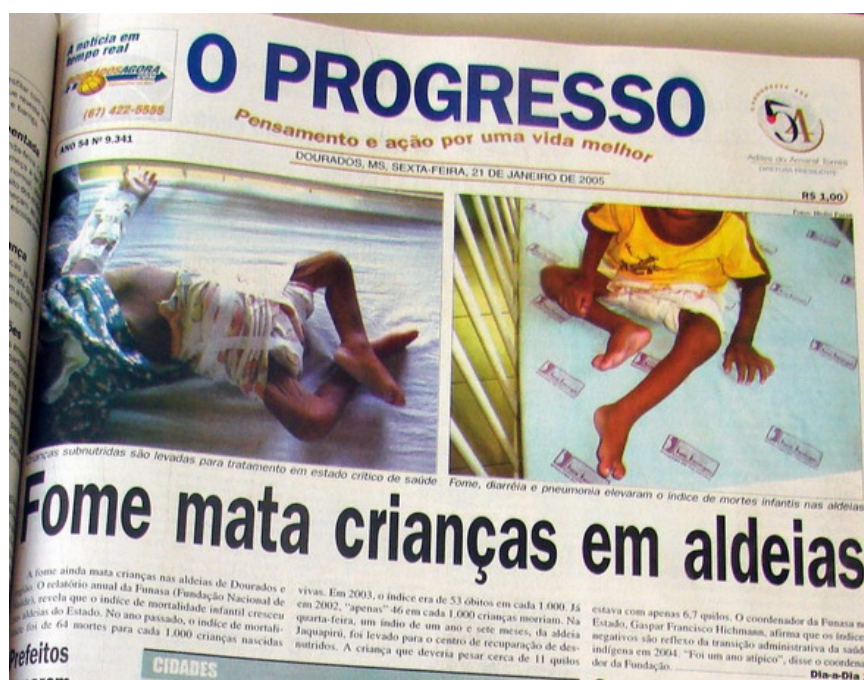
Figura 1 - Capa do jornal O Progresso, de 21 de janeiro de 2005.

No dia 21 de janeiro de 2005, o jornal O Progresso trazia a manchete: “Fome mata crianças em aldeias”, junto com duas fotografias de crianças desnutridas. Essa foi uma das primeiras notícias sobre o assunto, que seria abordada em veículos como a Folha de São Paulo e o Jornal Nacional, da Rede Globo. Nos dois meses analisados, O Progresso produziu 82 materiais jornalísticos sobre a desnutrição na região de Dourados.