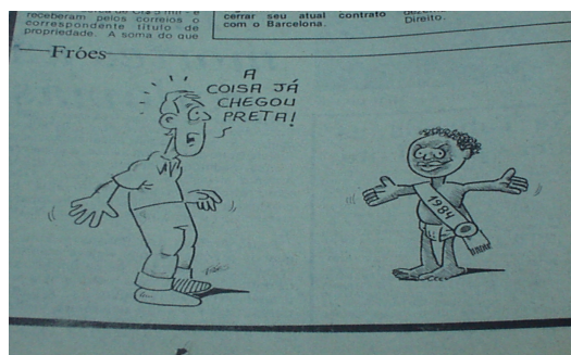
Imagem 2 - Charge Fróes

Já na charge do dia 03 de janeiro, o ano novo ruim é conotado por uma criança negra. O indivíduo que se depara com a imagem da criança negra, espantado, expressa uma mensagem lingüística: A coisa já chegou preta!