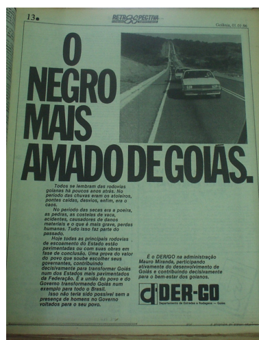
Imagem 3 - O negro mais amado de Goiás Jornal O popular , Goiânia, 01 de janeiro de 1986, p.8.

Uma publicidade do Departamento Estadual de Trânsito, no jornal O Popular de 01 de janeiro de 1986, trazia em destaque a seguinte frase: “O negro mais amado de Goiás”. A propaganda publicisava sobre a pavimentação asfáltica que o governo do estado havia realizado em 1985. Por outro lado, publicisava o “negro” que era amado aqui. Não o ser humano de pele mais escura, mas sim o asfalto, símbolo de modernidade urbanística, de bem estar e progresso. Porém, os atributos de progresso não se identificam com o negro dentro do discurso racista. O lugar do negro é baseado na construção do mundo social e da nação, que lhe impõe um lugar desprestigiado, e os clichês visuais servem para julgar, qualificar e posteriormente nomear, tornando-se clichês verbais de negativização.