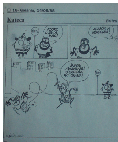
Imagem 5 - Kâteca

Em Goiás, até o início dos anos 1990, os meios de comunicação pouco ou quase nada noticiaram a organização e a luta do povo negro. Os artigos e ensaios de Martiniano Silva, um advogado e historiador autodidata goiano, e ativista do movimento negro, são quase as únicas aparições desse contra-discurso negro. Em geral, os artigos e imagens se restringiram a momentos como o 13 de maio e o 20 de novembro.