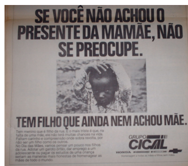
Imagem 4 - Tem filho que ainda nem achou mãe. Jornal O Popular , Goiânia, 13 de maio de 1988, p. 11.

imagem negativa do negro, uma criança que nem mãe possui, tranquilos podem ficar os leitores do jornal, maioria branca, de classe média e alta, uma vez que suas famílias não sofreriam do mal que ronda as famílias negras: