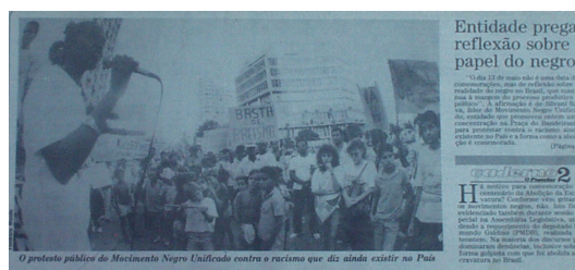
Imagem 7 - Protesto do MNU. Jornal O Popular , Goiânia, 13 de maio de 1988, capa.

O Popular de 13 de maio de 1988 traz à capa em destaque um quadro exposto através de uma imagem o protesto do MNU no Rio: