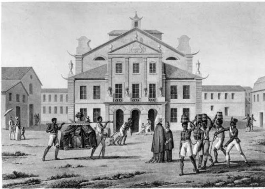
Fig. 1 – Real Theatro São João – obra de Nicolas Edouard LeRouge e Jacques Etienne Arago (Fonte: Lerouge & Bernard, Vista da casa de espetáculos no Largo do Rocio, Rio de Janeiro. Buril: coleção particular, Rio de Janeiro, 1820)

trabalharam posteriormente nos jornais, embora tendo falecido em 1854, no Rio de Janeiro, sua influência consistiu numa dinâmica de trocas e referências que foi se consolidando no decorrer dos oitocentos, criando padrões de ilustrações e desenhos específicos para o campo dos periódicos, essencialmente, para imprensa especializada em teatro, uma vez que, foi responsável pela seção de teatro do jornal Courrier du Brésil: politique, litterature, revue des theatres, sciences et arts-industrie , publicado no Rio de Janeiro até 1862.