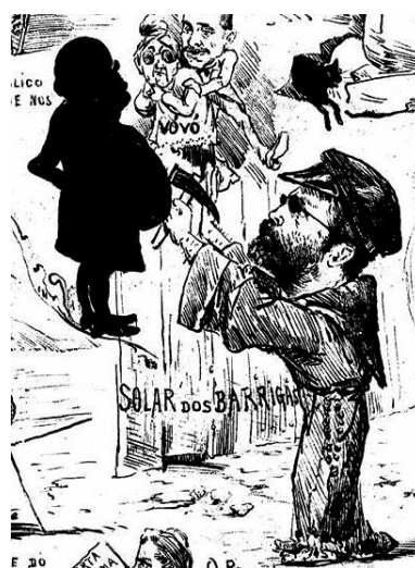
Fig. 4 – Detalhe Solar dos Barrigas

Para Huberman, consiste nessa dualidade do claro-escuro a capacidade de gerar interesse, afinidade e ressonância de uma imagem. Toda força da imagem reside em produzir sobrevivência de suas ideias, criando uma empatia com seus argumentos e essa forma se consolida de fato, por meio da exposição binária que conjuga dois universos. É uma forma conjugal, casal, que se mantém numa espécie de uma eterna gangorra de nuances de claro-escuro. É exatamente essa forma binária que estabelece a conexão entre a imagem e o conteúdo. Esse efeito ocorre por meio de um ponto de comparação: forma/conteúdo - conexão conjugal. O aspecto de historicidade que determina o sentido, por meio de um processo associativo comparativo. Os fundos obscuros, as sombras e silhuetas de uma imagem constitui sua sobrevivência que ressoa suas ideias. Aquilo que nos atrai em uma imagem seria sua forma obscura expressa nos símbolos do claro-escuro.