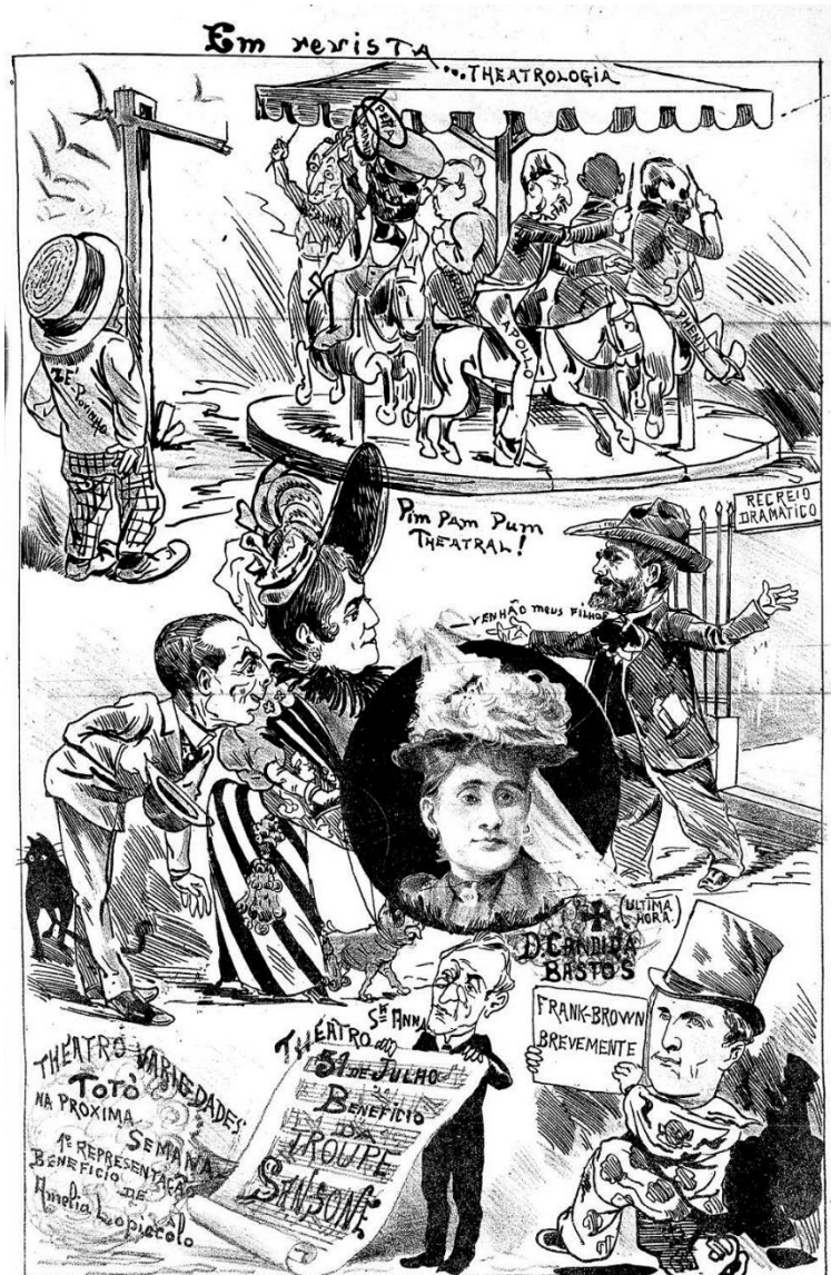
Fig. 6 – Em revista...

Nesse sentido, para compreender a cena como consequência de um processo complexo da produção teatral é importante ressaltar o papel significativo que a imprensa operou no âmbito da esfera pública teatral, tanto promovendo espetáculos, artistas e teatros quanto estabelecendo cânones, fomentando empreendimentos, autorizando escolhas, temáticas e, ainda, influenciando toda uma geração de assistência da cena.