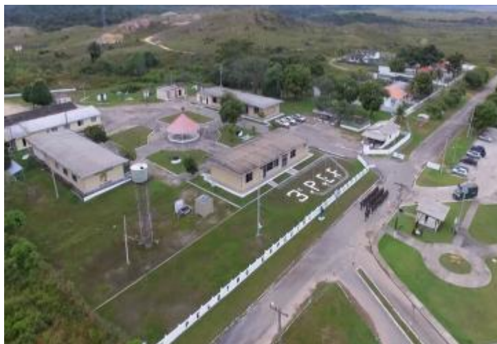
Figura 3 – 3.º PEF – Pacaraima-RR

Elena de Uairén, um dos marcos de fronteira mais famosos é o Marco BV-8 (antiga Vila de Pacaraima).