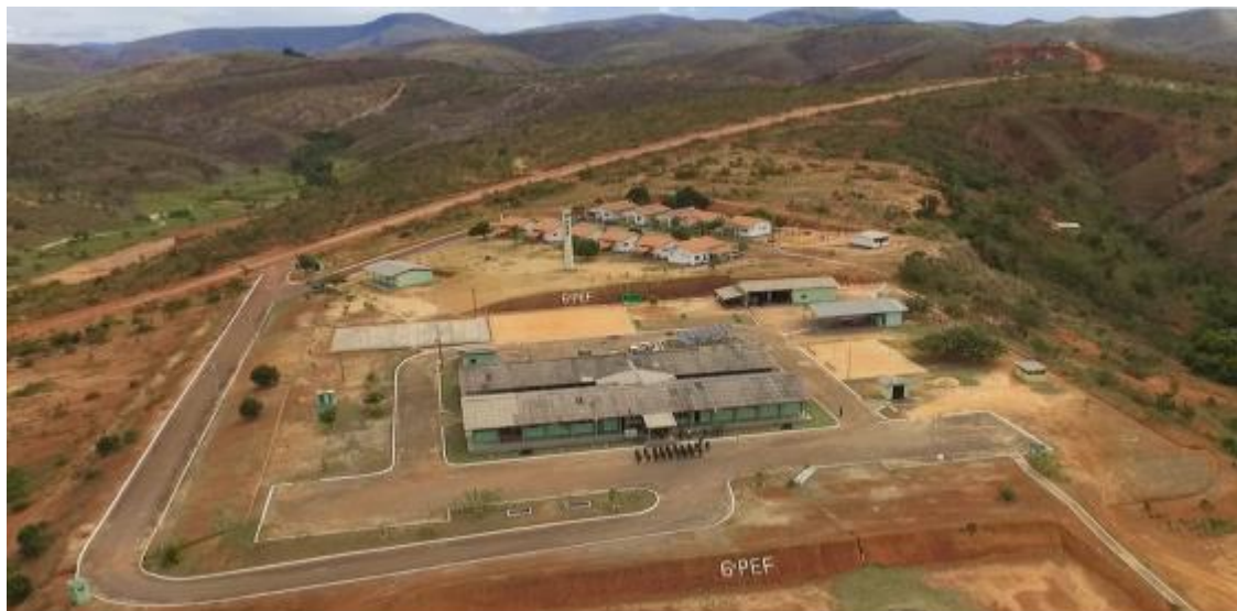
Figura 6 – Vista aérea do 6.º PEF, Uiramutã