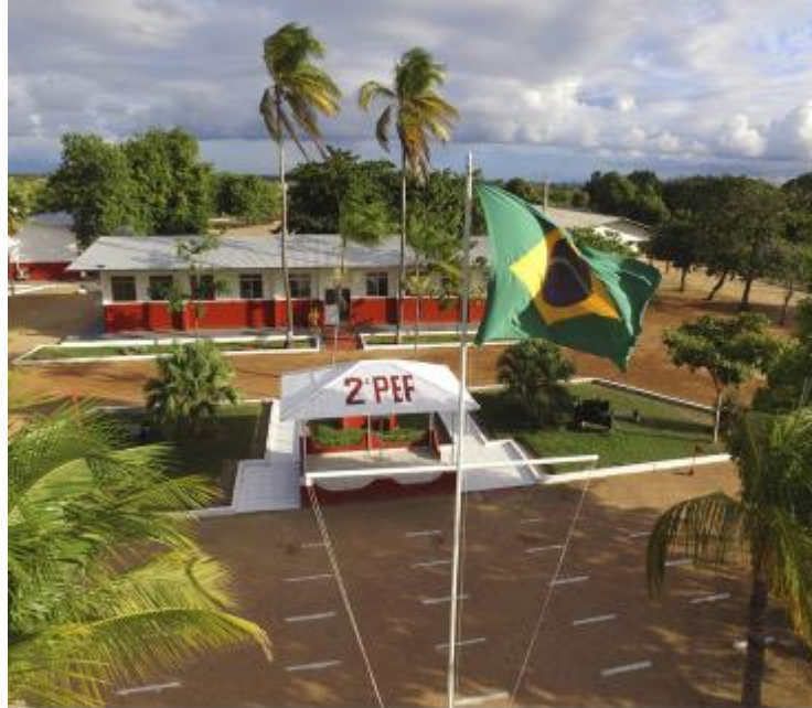
Figura 2 – 2.º PEF – Normandia-RR