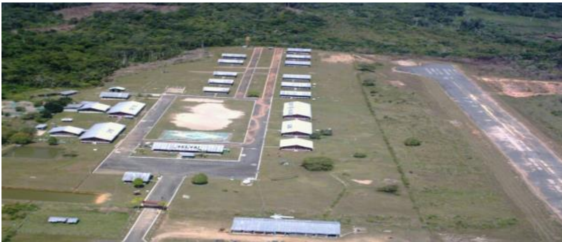
Figura 5 – Vista aérea do 5.º PEF, região de Auaris, TI Yanomami, fronteira com a Venezuela

O 5º PEF é responsável pela vigilância de parte da fronteira seca com a Venezuela. Graças ao isolamento da região, são registradas pouquíssimas atividades de garimpo ilegal. Próximo ao 5º PEF vivem cerca de 2.000 índios das etnias Sanomá e Yecwana, distribuídos em 30 comunidades. Atualmente três indígenas Sanomás e um Yecwana servem como soldados e têm atuação destacada como guias e intérpretes. Possui onze PNR 3 para as famílias dos oficiais, sargentos e cabos, que ali residem. A pista de pouso de Auaris é asfaltada e tem 1200m de comprimento. (Cf. HISTÓRICO PEF. http://www.7bis.eb.mil.br/histórico.html ).