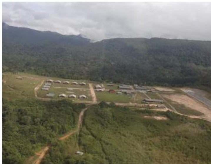
Figura 4 – Vista aérea do 4.º PEF, região de Surucucu

Abaixo, podemos observar um panorama aéreo da região de Surucucu TI Yanomami, onde foi instalado o 4.º PEF. Esta região, enfrenta diversos conflitos entre garimpeiro e indígenas, sendo necessárias ao longo do tempo, várias intervenções dos PEFs, a fim de coibir as ações ilegais. 2