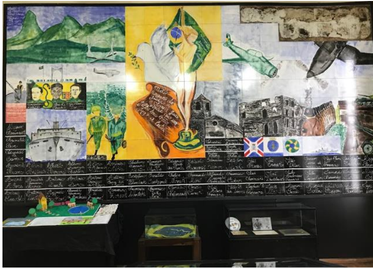
Figura 6: “Os Expedicionários”, de Jorge Omar Pagano.

Os painéis invisibilizam a história de indígenas e negros. Há uma importante comunidade quilombola na região, o “Palmital dos Pretos”. Os Guarani ensinaram aos primeiros povoadores do Paraná a utilizar erva-mate, que se tornou o principal produto de exportação paranaense no século XIX. Em 1875, havia na região de Campo Largo 13 engenhos ligados à extração de erva-mate. Um dos locais é hoje chamado Parque do Mate e é o único bem tombado do município de Campo Largo.