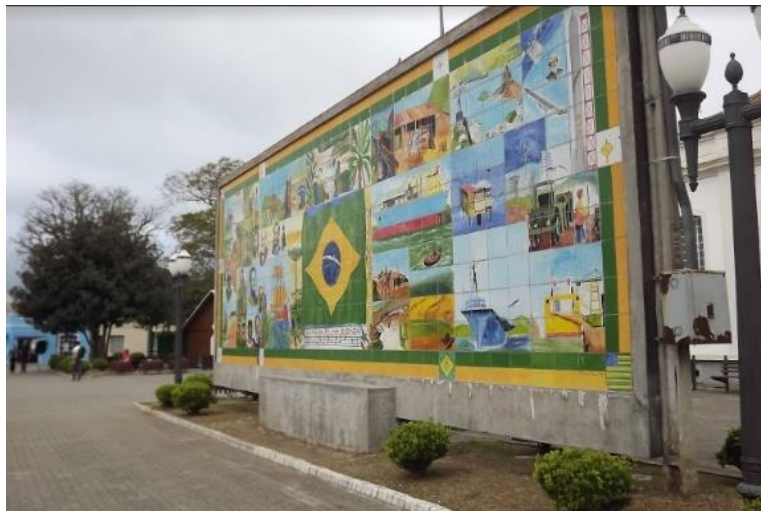
Figura 5: Painel “Brasil 500 Anos”, do artista Jorge Omar Pagano. Enaltece paisagens naturais e os símbolos nacionais.