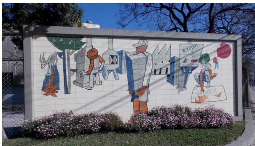
Figura 1: Painel de Poty Lazzarotto situado em frente à INCEPA.

O painel de Lazzarotto em Campo Largo valoriza o trabalhador e expressa a relação da indústria com a natureza apresentando os edifícios e fornos em meio a árvores, um animal e o sol. Lembremos que a matéria-prima para a produção de cerâmica (argila caulínica) atraiu as empresas à região e o trabalho de imigrantes foi fundamental para o setor. A imagem valoriza os trabalhadores suíços. O trabalhador central carrega muitos azulejos, demonstrando força: mãos e braços têm grande proporção. Outro trabalhador desenha, denotando a arte e a criatividade que seriam necessárias na cerâmica. A pintura também apresenta a palavra “export” para se referir à importância do mercado externo para economia local.