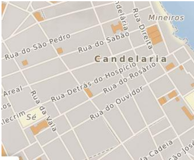
Figura 1: Mapa do centro do Rio de Janeiro 1808-1821, região da rua do Ouvidor.

A figura a seguir (figura 1) nos permite verificar como era organizado, a partir das ruas, uma parte do centro do Rio de Janeiro no princípio do século XIX.