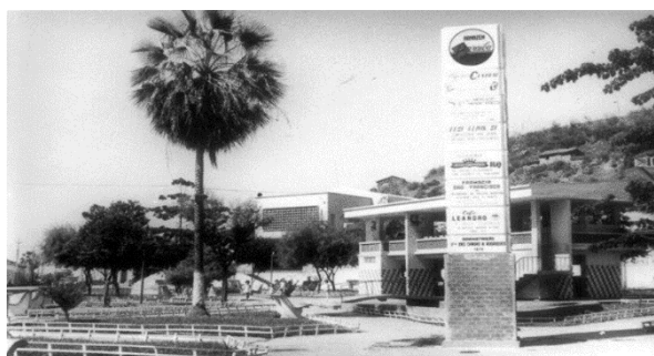
Figura 1: Praça Félix Pacheco, no centro de Picos-PI, (década de 1980).

A Praça Félix Pacheco localiza-se na Rua São Sebastião, no centro da cidade de Picos-PI. Abaixo segue uma imagem da Praça Félix Pacheco nos anos 1980, como um espaço aberto, público e de lazer: