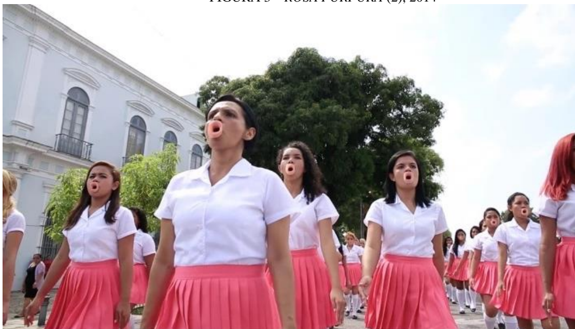
FIGURA 3 – ROSA PÚRPURA (2), 2014

FONTE: REALE, Berna. Rosa Púrpura , Belém, 2014. In: Berna Reale. Galeria Nara Roesler. 27 ago. 2018. Disponível em: < https://nararoesler.art/radar/532/ >. Acesso em 7 fev. 2023.