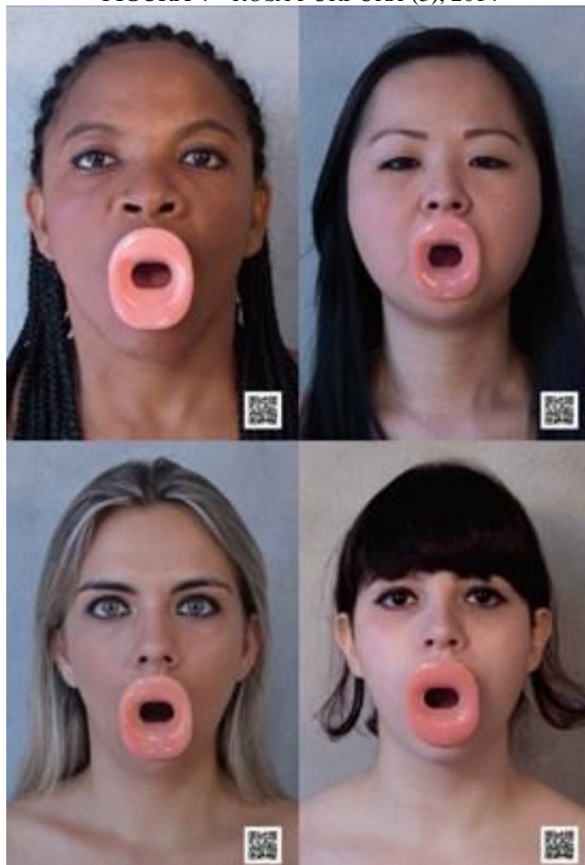
FIGURA 4 – ROSA PÚRPURA (3), 2014

FONTE: BERNA, Reale. Rosa Púrpura , Belém, 2014. In: Berna Reale Portfolio. Galeria Nara Roesler. Disponível em: < https://nararoesler.art/usr/library/documents/main/69/gnr-berna-reale-portfolio.pdf >. Acesso em 7 fev. 2023.