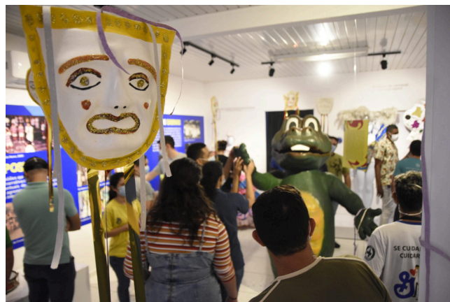
Exposição: Minha Terra Que Delícia, Quantos Carnavais