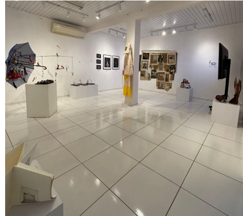
39º Salão de Artes Plásticas de Jacarezinho