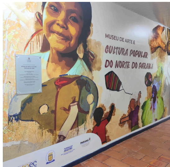
Museu de Arte e Cultura Popular do Norte do Paraná

Atualmente, estão em cartaz a exposição do 39º Salão de Artes Plásticas de Jacarezinho e a mostra permanente “Minha terra, que delícia, quantos Carnavais”, que seguem atraindo público e consolidando o MACPop como um polo dinâmico de arte e memória popular.