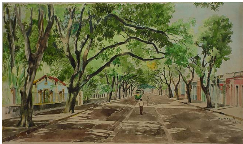
Imagem 3: Georges Wambach. Av. Independência , 1939, aquarela, 36 x 62 cm.

Nas pinturas de Georges Wambach, de 1939, é a luz que ganha destacada importância e se revela em grandes proporções. O artista belga que veio para o Brasil em 1935, percorrendo o território brasileiro em busca de novas pesquisas para suas obras, pintou diversos monumentos e aspectos urbanos das cidades por onde passou. Avenida Independência foi pintada quando de sua estadia na capital paraense no ano de 1939 e retrata uma importante avenida da cidade, atualmente chamada Avenida Magalhães Barata, paralela à antiga Avenida São Jerônimo, hoje chamada de Avenida Governador José Malcher. A perspectiva escolhida por Wambach cria um forte paralelo com a obra de Antonio Parreiras, analisada anteriormente, pois, coloca no centro da composição a horizontalidade da rua que se prolonga infinitamente, acompanhada pelos trilhos do bonde elétrico, valorizando a profundidade da tela. O enquadramento da paisagem deixa ver com maior clareza a arquitetura local das residências à margem da via urbana, reveladas num colorido harmonioso que dialoga com o restante da composição.