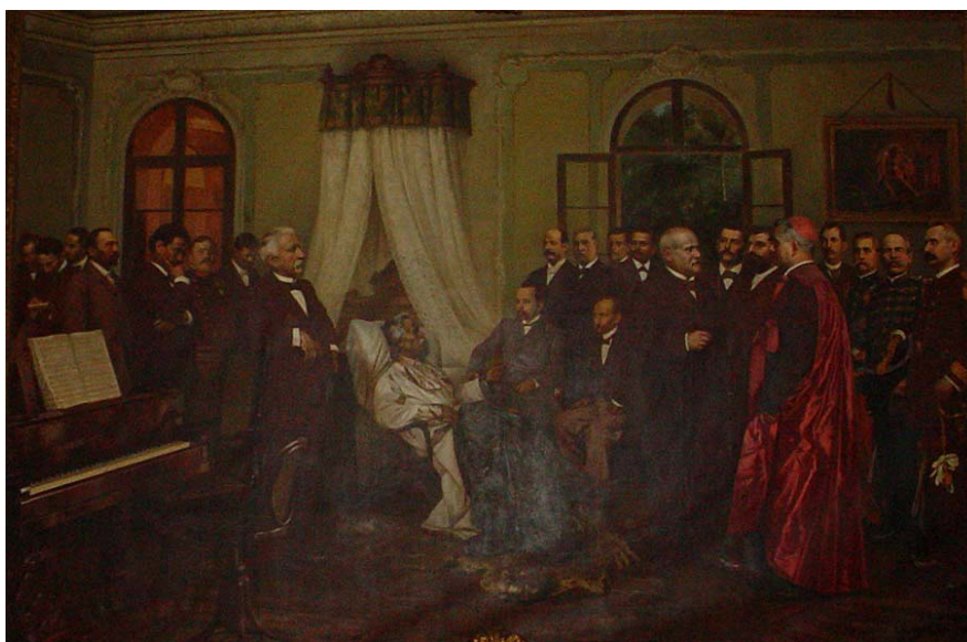
Acervo do Museu de Arte de Belém (PA)

Imagem 1: Domenico De Angelis & Giovanni Capranesi. Últimos Dias de Carlos Gomes , 1899, óleo s/ tela, 224 x 484 cm