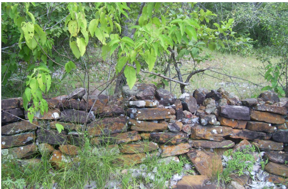
Fig. 2 – Muros de Pedra da Fazenda Fortaleza

Nesta perspectiva lugar é entendido por Certeau (1990:201) “ um lugar é a ordem (seja qual for) segundo a qual se distribuem elementos nas relações de coexistência”. Assim os lugares com evidências de material arqueológico significativo perpassa pela análise da paisagem na região.