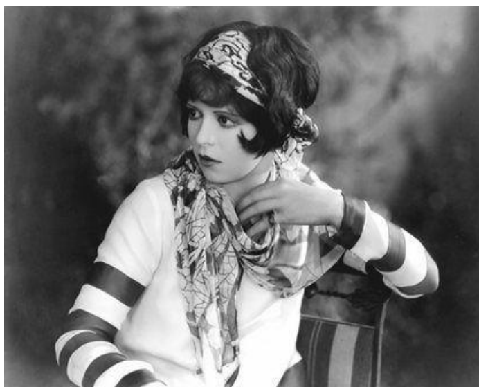
Clara Bown, o tipo flapper por excelência, em cena do filme Kid Boots (1926)

Forjadas no processo de urbanização e industrialização dos EUA pós Primeira Guerra, as flappers representavam as mulheres modernas, independentes, com vontade própria, que trabalhavam fora e não tinham como objetivo de vida o casamento. Representadas nas telas do cinema como boas meninas, fortes, simpáticas, generosas e esportistas, elas saíam às ruas sozinhas, usavam cabelos curtos, vestidos com franjas, adereços de cabeça, pulseiras, colares, fumavam e não dispensavam a maquiagem.