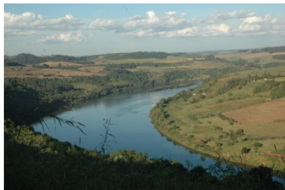
Figura 05: Vista do Rio Uruguai e das margens pertencentes aos municípios de Caxambu do Sul/SC (esquerda) e Alpestre/RS (direita) em 2008. Atualmente parte das margens encontra-se alagada, formando o reservatório da UHE Foz do Chapecó. Foto: André Luiz Onghero, 20/05/2008.