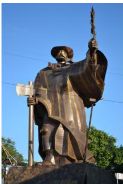
Figura 01: Monumento o Desbravador – Chapecó – SC Foto: André Luiz Onghero, 14/03/2011

Ao transitar pela praça central da cidade de Chapecó, ao lado da igreja matriz, avista-se o “desbravador”, monumento de 14 metros de altura e nove toneladas, em forma de um homem vestido com poncho e chapéu representando um “gaúcho” (Figura 01). A mão direita segura um machado que lhe serve de apoio enquanto levanta um ramo de louro com a mão esquerda. Olhando para o louro, que levanta como um troféu, o personagem simboliza a vitória dos colonizadores gaúchos sobre o sertão selvagem. O monumento foi, criado em 1981 pelo artista plástico Paulo Siqueira em comemoração ao aniversário do município, para homenagear os supostos desbravadores de Chapecó, e tem sido utilizado como um dos principais símbolos do município.