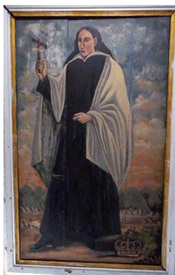
Fig. 2 - S. Eduardo Rei da Inglaterra. Séc. XVIII. Autor: Manoel de Jesus Pinto. Fev. 2011.

Não podemos esquecer que a arte barroca é absolutista por excelência, entrelaçando, dentro do poder régio, uma aura religiosa de exaltação da figura do rei, inclusive canonizando aqueles que mais se destacaram como o Rei Luís IX da França e a Rainha Isabel de Portugal.