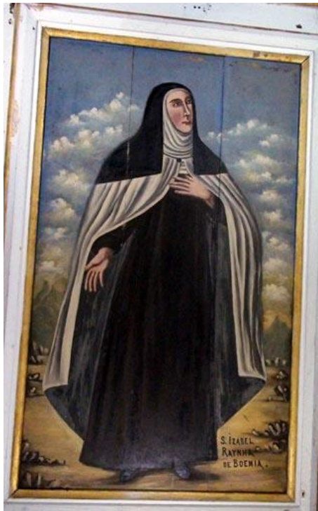
Fig. 3 - S. Isabel Rainha de Boemia. Séc. XVIII. Autor: Manoel de Jesus Pinto. Fev. 2011.