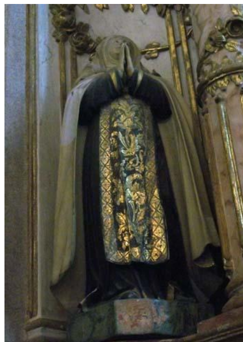
Fig. 6 - S. Archangela. Séc. XVIII? Autor: Desconhecido. Fev. 2011. 12

O último painel, à primeira vista, não suscita problemas de identificação; trata-se de São Henrique de Grei (Fig. 7). A figura segura uma vanita , tema comum nas pinturas barrocas. De acordo com Cremades e Turina (2001: 248): “O tema hamletiano da meditação perante a caveira se estende ao século XVIII na pintura espanhola.” 13