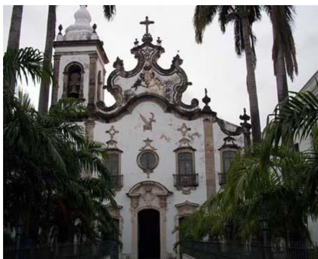
Fig. 1 – Igreja da Ordem Terceira de Santa Teresa de Jesus do Recife. Fev. 2011.

A arte religiosa não refletia unicamente, através de sua iconografia, a posição da doutrina da igreja, mas também as novas ações religiosas que, depois da Reforma e Contra-Reforma, só podiam assumir duas alternativas: o caminho da mística ou a via da ação direta que pregava os jesuítas, com a mesma valorização por ambas as partes da ascética como meio de perfeição moral, e demonstrava, finalmente, a viabilidade deste comportamento mediante o exemplo dos santos, cujas representações vieram substituir quase por completo os temas bíblicos, e cujo culto se fomenta como resposta à rejeição por parte dos protestantes. (CREMADES; TURINA, 2001: 228). 3