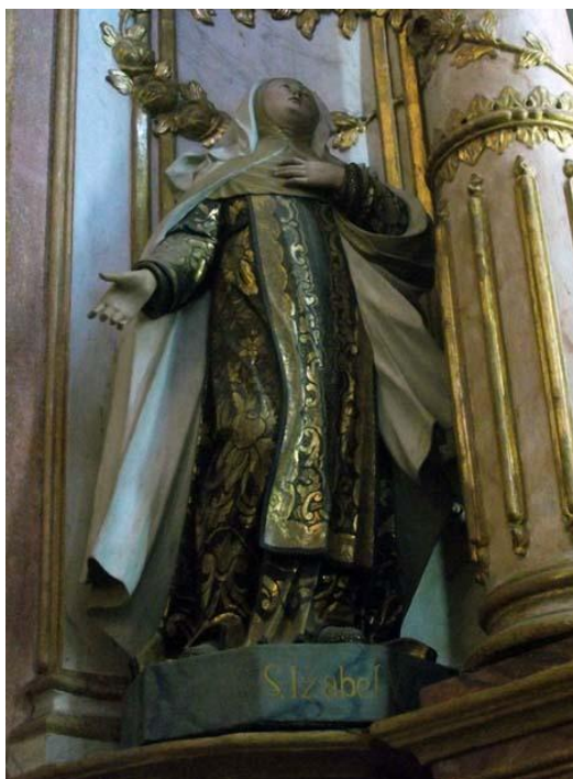
Fig. 5 - S. Izabel V. Séc. XVIII? Autor: Desconhecido. Fev. 2011.

não identifica que estátuas eram essas e se seriam as mesmas que vemos nos dias atuais (Fig. 5 e 6). 11