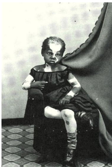
Imagem 4 – “Menino leopardo” exibido por P. T. Barnum.