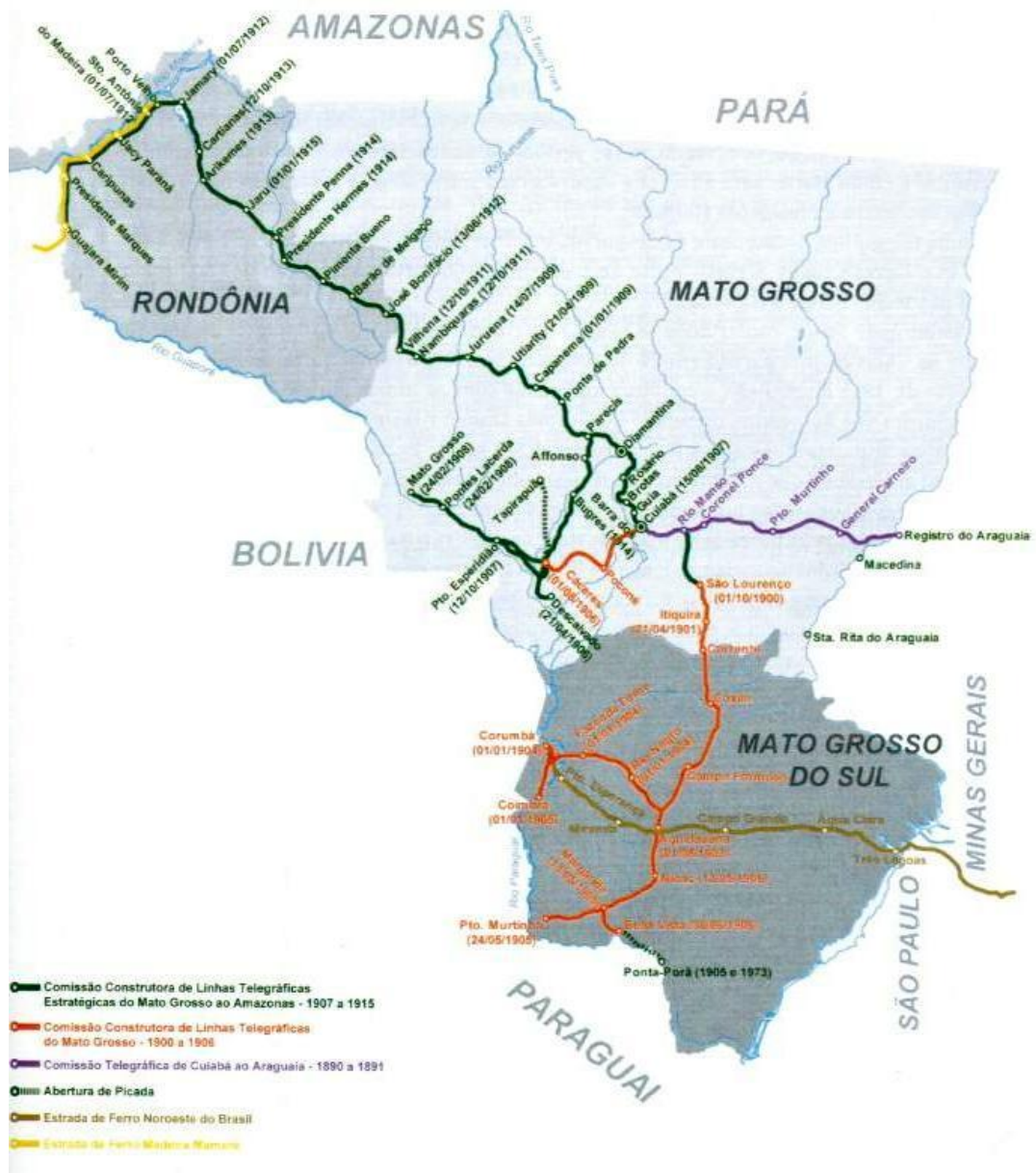
Avanço da Comissão Rondon nos estados do MS, MT e RO de 1890 a 1915

animais cargueiros e, com eles, das coleções de história natural e chapas fotográficas recolhidas até ali (SÁ; SÁ; LIMA, 2008, p.793).