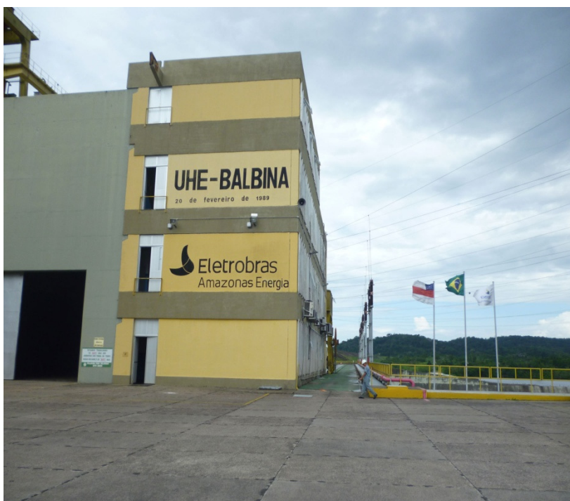
Figura 1 : Usina Hidrelétrica de Balbina, localizada na Bacia do Rio Uatumã, no Município de Presidente Figueiredo, precisamente no Distrito de Balbina, Estado do Amazonas .

Toda essa demonstração de força, luta e resistência, são reflexos do espírito guerreiro desse povo, que ao longo dos anos vem se superando a cada dia ,resultando em um magnífico exemplo de coragem para todos nós.