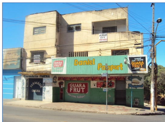
Fig.03 Fachada atual do prédio onde funcionava o Cine São Luiz

O Cine São Luiz, situava-se na Avenida Muniz Falcão, próximo a ferrovia, de boa localização e infraestrutura. Mais tarde também teve o mesmo fim dos outros cinemas, fechando as portas no final da década de 1960.