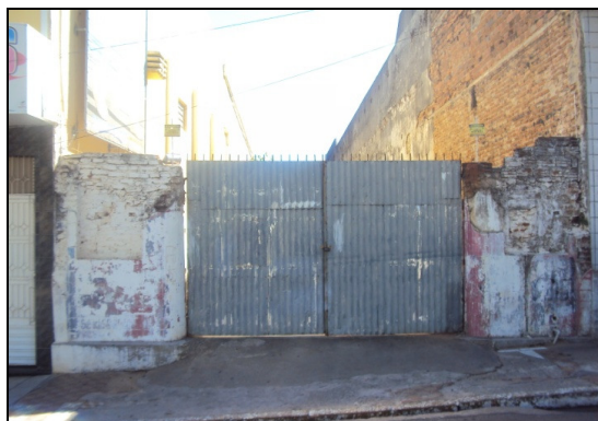
Fig.04 Local onde funcionava o Cine Moderno/Ideal