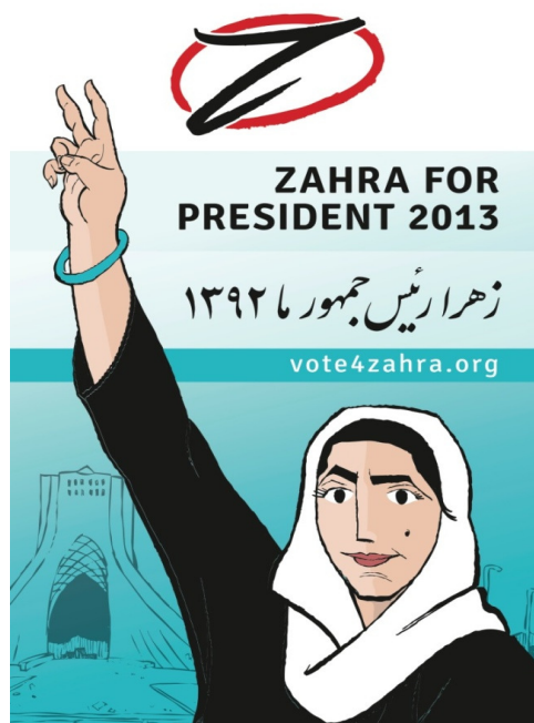
Figura 4: Zahra, a candidata virtual à presidência do Irã (2013).