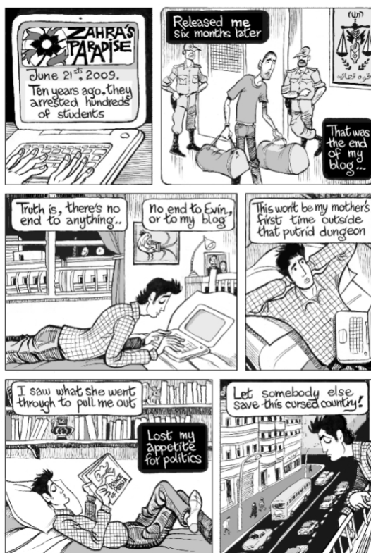
Figura 3: Zahra's Paradise, 2009 (reprodução em inglês disponível em: http://vote4zahra.org/about/zahras-story/ )

Inspirados na história de jovens que sofreram violência durante os protestos pelas eleições presidenciais de 2009, o escritor iraniano Amir Soltani e o desenhista árabe Khalil, lançaram o romance gráfico Zahra's Paradise (o Paraíso de Zahra). A obra, inicialmente publicada em capítulos, tornou-se campeã em vendas pelo New York Times , obteve duas indicações ao renomado prêmio Eisner e já foi traduzida em dezesseis idiomas.