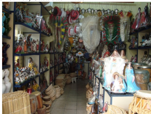
Figura 1 – Comércio de artigos votivos, Casa das Ervas

para se fazer santo no Candomblé existem folhas que aqui para nós é muito difícil de serem encontradas. Então, ou se busca em Curitiba ou minha família de santo manda de São Paulo para cá! A nossa flora aqui é muito rica, porém, não são as folhas de axé! E quando você acha alguma coisa por aqui você tenta cultivar para poder ter. (CUNHA, 2011.)