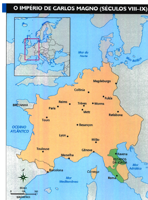
Imagem 1- Dimensão sincrônica