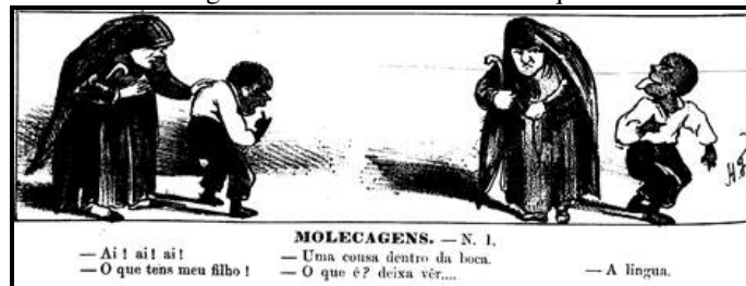
Figura 3 – Ousadia de um moleque

A ousadia dos escravos também era outro aspecto destacado em muitas das charges. No contexto da época, em que o cativo estava se integrando gradativamente à sociedade, seja como liberto ou não, suas atitudes fora do aceitável eram consideradas ousadia e afronta à autoridade dos brancos. A Semana Illustrada denunciava em forma de humor o comportamento do escravo e, ao mesmo tempo, comportava também uma crítica à seriedade dos senhores. Na figura 3, um moleque faz chacota com uma senhora branca, ao fingir que tem algum problema na boca e, quando a senhora se aproxima, ele revela sua piada.