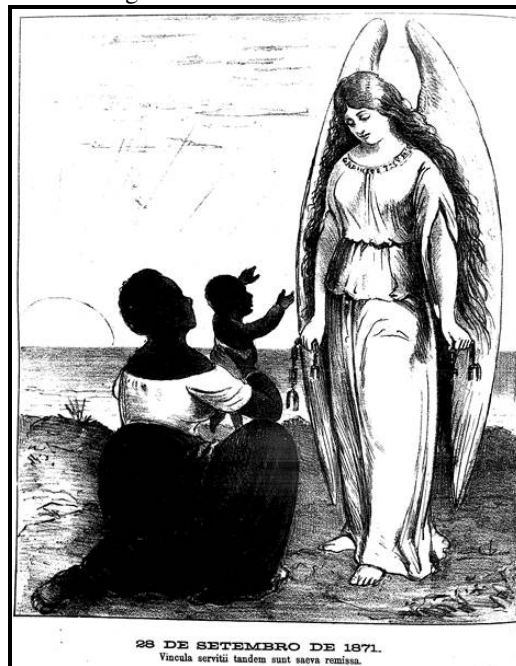
Figura 1 – Lei do Ventre Livre

A figura 1 mostra uma escrava e um bebê, provavelmente seu filho, em posição de reverência em frente a um anjo. Esse anjo, representado na figura de uma mulher, é branco e na gola de sua veste lê-se a inscrição “Gabinete 7 de março”. Ele segura correntes rompidas nas mãos, como se tivesse libertado o bebê das agruras da servidão. O bebê ergue os braços em direção a ele, como se estivesse agradecendo. O sol nascente, ao fundo, passa a ideia de um futuro próspero para a nação. Desta forma, a nova lei anunciava um Brasil que tentava aos poucos se livrar deste peso que era a mão de obra escrava.