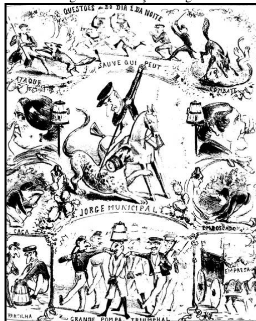
Figura 2 – A caça aos tigres