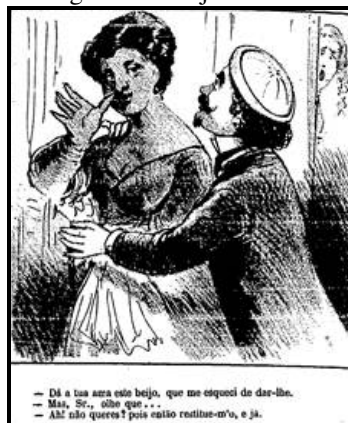
Figura 5 – Beijo roubado

– Dê a tua ama este beijo, que me esqueci de dar-lhe.