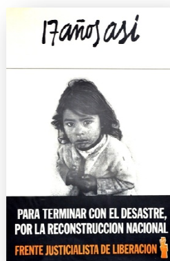
Documento 3 “17 años así”, 1972

Em uma disposição que intercala texto e imagem, os elementos gráficos dos cartazes são: texto introdutório; fotografia, ao centro; texto conclusivo; e autoria, que indica a opção política para onde se deseja persuadir. Os textos trazem como conteúdo: “17 Anos assim – Para terminar com o desastre – Pela reconstrução nacional – Frente Justicialista de Libertação”. A frase-título introduz e evoca o sentido da denúncia, que está representada nas fotografias centrais, ao mesmo tempo em que antecipa a concepção de seus autores sobre os (até então) dezessete anos de proscrição política do peronismo.