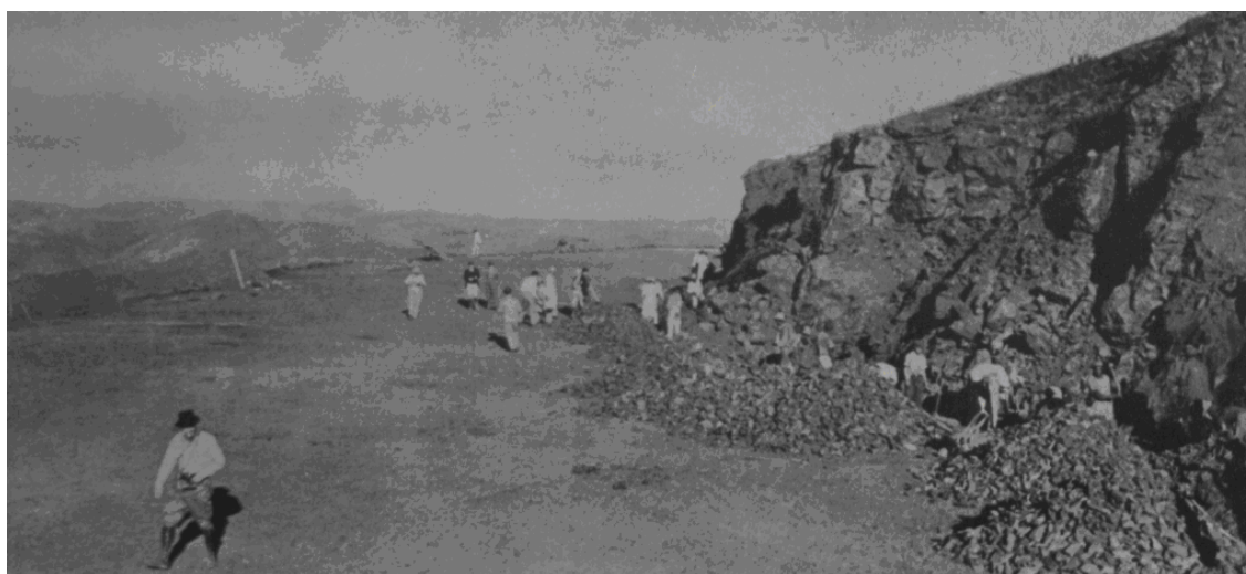
Imagem 29 20 : Pedreiras no Vale do Rio Doce.

A promessa de uma habitação digna, juntamente com as expectativas de crescimento rápido do Brasil por meio da exploração de seus vastos e ricos recursos minerais, acompanhado da modernidade e conforto que tais empresas interioranas ofereceriam aos seus trabalhadores, tornava a propaganda impressa em ‘Em Guarda’ bastante tentadora para os milhares de famigerados dos confins brasileiros. As imagens abaixo retratam uma mina de ferro, com riqueza imensurável em minérios e uma futura e equiparada Vila de Operários da Vale do Rio Doce. Tais fotografias servem para contrastar os avanços que seriam verificados na inóspita região, com a efetiva ocupação e o avanço de tal espaço: