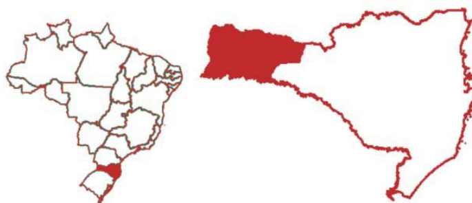
Figura 01 – Localização do município de Chapecó e sua dimensão territorial entre 1917 e 1953

A historicidade da constituição do espaço rural é um importante elemento para compreender uma região. Especialmente a região oeste de Santa Catarina, que tem sua dinâmica social e econômica diretamente ligada ao meio rural e na atualidade encontra-se atrelado à indústria alimentícia e sujeito às oscilações do mercado e às intempéries climáticas. Território disputado durante séculos, tem presente o conflito entre agricultores e indígenas em relação ao direito às terras e foi o berço de movimentos sociais como Movimento das Mulheres Agricultoras (MMA, posteriormente renomeado para Movimento das Mulheres Camponesas MMC), Movimento dos Atingidos por Barragens (MAB) e Movimento dos Trabalhadores Rurais Sem Terra (MST).