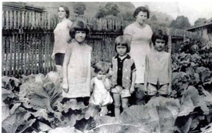
Figura 07 – Grupo de pessoas em meio a uma plantação de repolho. Nova Itaberaba-SC

domésticos que ficavam soltos no pátio, principalmente galinhas.