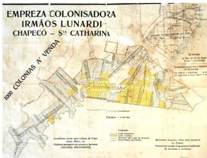
Figura 04 – Mapa de terras da Empresa Colonizadora Irmão Lunardi

Os mapas também eram utilizados para a divulgação e venda das terras. A figura 04 apresenta um mapa da Empresa Colonizadora Irmãos Lunardi e indica alguns dos elementos utilizados como “propaganda”, entre eles, a existência de quedas d’água para “instalação de serrarias e moinhos”, além do “clima mais saudável do estado”.