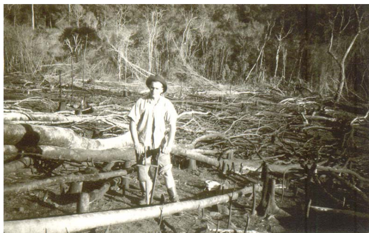
Figura 05 – Plantio de milho em São Miguel do Oeste-SC

mesmo uma forma de motivar outros conhecidos ou familiares a mudar-se para a região, em busca de melhores condições de vida. Extrapolando sua função original, fornecem-nos indícios sobre as práticas agrícolas utilizadas na época, como o plantio em meio aos restos de mata queimada, técnica conhecida como coivara , representada na imagem a seguir.