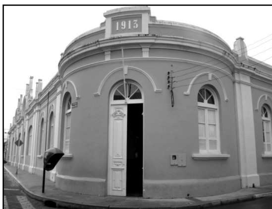
FIGURA 1. Fachada do Grupo Escolar Esperidião Marques.

4 sociais morais úteis a massa popular, conhecimentos voltados ao progresso dos grupos sociais a qual pertencem, com o pensamento a sua pátria.