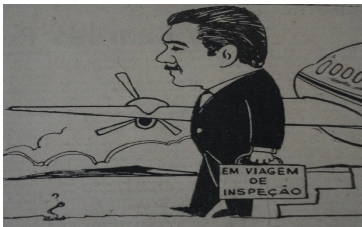
Figura 28: Jornal de Bolso 13 , São Luís, 21/06/1968.

exaltação do líder que não esmorecia com as acusações levianas que lhe eram proferidas. Nessa ótica, a resposta era dada com imagens das obras de estruturação do Estado e o afincamento com que o governador tratava a coisa pública.