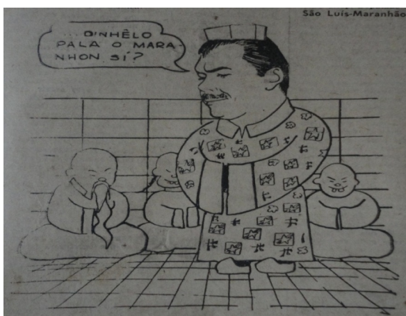
Figura 26: Jornal de Bolso 10 , São Luís, 25/06/1968.

Sarney captou bem o corte que a sociedade maranhense ansiava por fazer entre o velho e o novo, entre o moderno e o arcaico e expressou isso em sua proposta de governo, sintetizada pela expressão “Maranhão Novo” [...]. A dinâmica administrativa se caracterizou por uma tendência centralizadora do processo decisório e insulamento da burocracia, pautando-se na perspectiva do desenvolvimento e da modernização (GUILHON, 1996: 8).