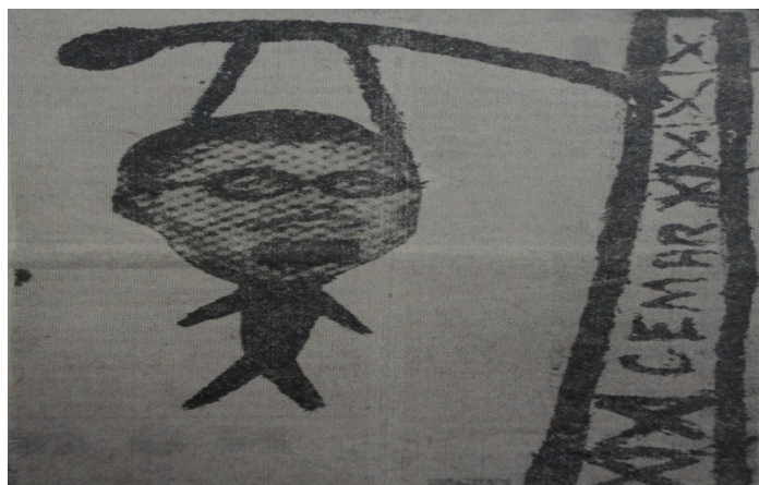
Figura 27: Jornal Pequeno 12 , São Luís, 28/03/1970.

No entanto, quando falamos nesta “oposição” é prudente delimitar o seu sentido, de modo algum ela estava vinculada a uma crítica expansiva ao governo federal. Pelo contrário, o governo militar pairava nos debates como um bem dissociado das supostas práticas abusivas do então governador. A carga crítica era direcionada ao chefe do executivo estadual maranhense, direta ou indiretamente.