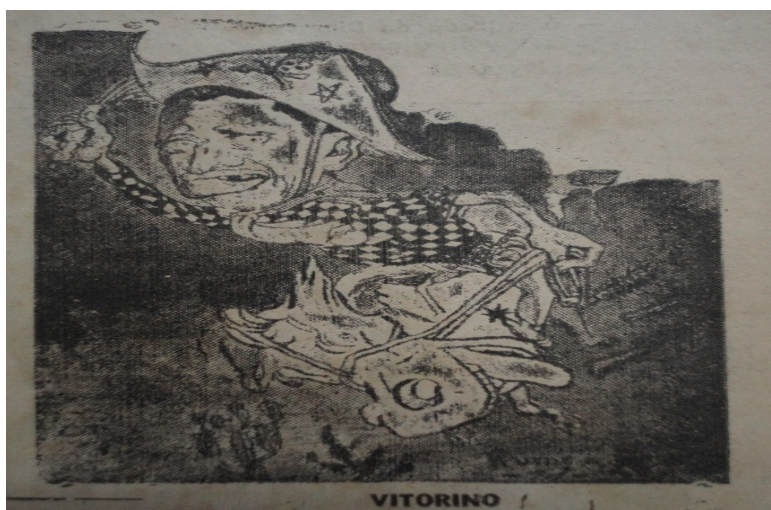
Figura 20: Jornal do Povo 3 , São Luís-MA, 16/01/1964, diretor geral: Neiva Moreira.