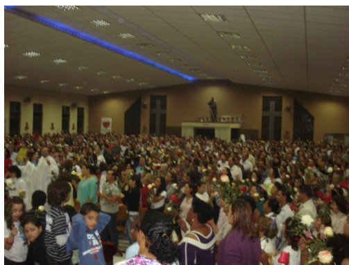
Foto nº01: Novena à Santa Rita de Cássia da Paróquia em Maringá/PR. Data: 22/05/2012.

Quando o padre anuncia o início da missa direcionada à Santa Rita de Cássia, começam os cânticos para a santa e os fiéis levantam suas rosas para serem abençoadas pelo padre de acordo com a figura 1. O padre também direciona os pedidos de intercessão à Santa Rita de Cássia. Também, durante a novena alguns devotos pronunciam seus ex-votos para o público da paróquia, estes pelos quais observam atentamente. É realizada também a liturgia da palavra e a oração aos doentes.