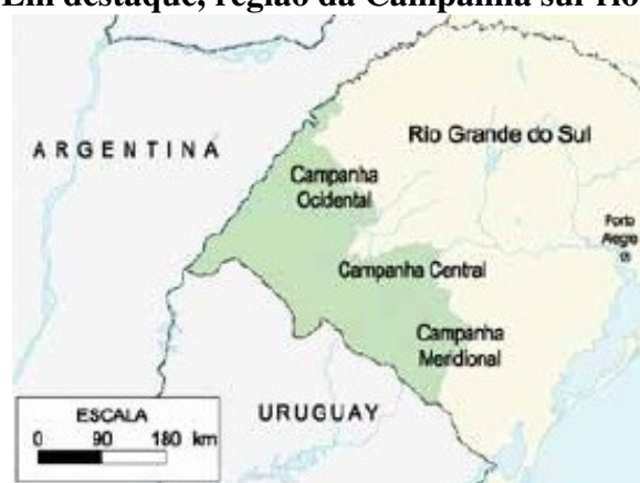
Mapa 1 – Em destaque, região da Campanha sul-rio-grandense: