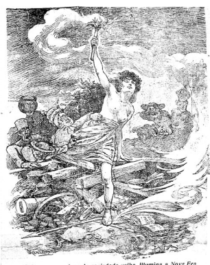
Figura 1 A Plebe. 12.04.1919

Contudo, nosso objetivo principal não foi identificar os elementos imagéticos que fundamentaram um discurso ideológico. Não se trata de definir hierarquicamente a supremacia do discurso impresso utilizando a imagem como ferramenta ideológica, essa sem dúvidas seria uma abordagem estreita da percepção que se estabelece sobre nosso objeto de estudo. Procuramos identificar de que formas é possível compreender a visualidade e a importância dela dentro do contexto de uma cultura associativa que lentamente produz elementos para a constituição de uma cultura verdadeiramente operária no Brasil, calcada num substrato de identidade classista. Não obstante, esse processo, se configura apenas num período posterior de nossa história, porém podemos encontrar aqui a gênese de alguns de seus elementos.