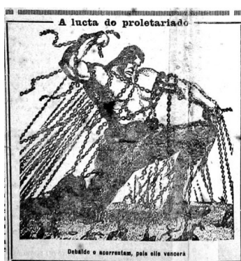
Figura 3 A Plebe. 18.03.1922