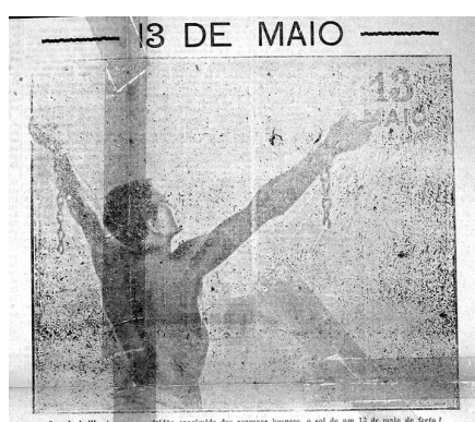
Figura 4 A Plebe. 14.05.1921