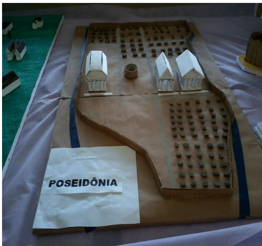
Fotografia 4 - Maquete representando a cidade-estado da Grécia Antiga Poseidônia, feita por um grupo de estudantes do 1º C e exposta na Feira Cultural e Científica do Ensino Médio da Etec Dr. Emílio Hernandez Aguilar de 2012.