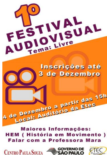
Figura 2 - Cartaz divulgando o I Festival da Etec Dr. Emílio Hernandez Aguilar de 2012. Arte do Prof o Maggayver Grecco.