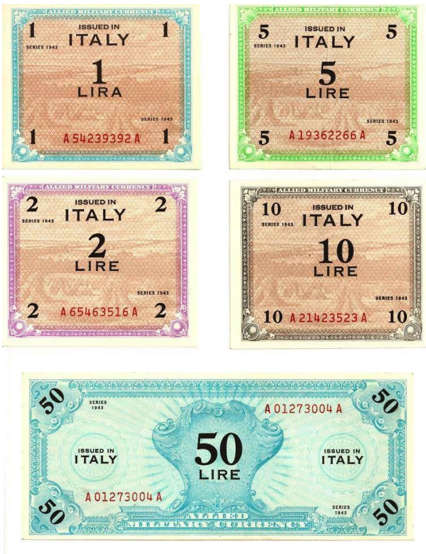
Fotografia 1: Alguns exemplares de AM Lira

Segundo SANDOVAL (2012), a autorização para circulação destas cédulas foi oficializada por decreto assinado pelo General inglês Harold Alexander (Decreto nº 12 de 23 de agosto de 1943) e introduzidas para circulação no mesmo dia da assinatura do decreto. Os valores desta primeira série de cédulas, chamada de Series 1943 , foram: 1, 2, 5, 10, 50, 100, 500 e 1.000 liras. Houve uma segunda emissão dessa mesma série, com circulação a partir dia 8 de setembro de 1943, agora impressas pela Forbes Lithograph Manufacturing Company de Boston. As cédulas impressas por esta companhia contêm a marca da empresa impressora, um “F” em micro caracteres (aposto na rosácea do lado inferior direito).