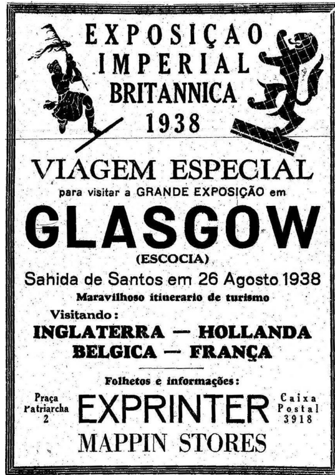
Figura 3 - Anúncio Exprinter, O Estado de S. Paulo, 26/06/1938.

ponto de vista imagético, apontando para a existência de um público receptor já habituado com a oferta turística no meio impresso.