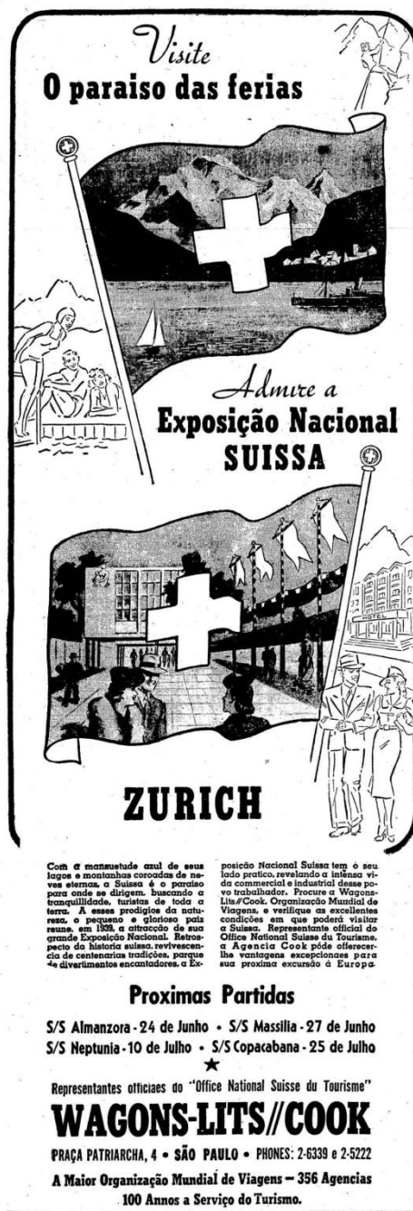
Figura 7 - Anúncio Cook, O Estado de S. Paulo, 18/06/1939.