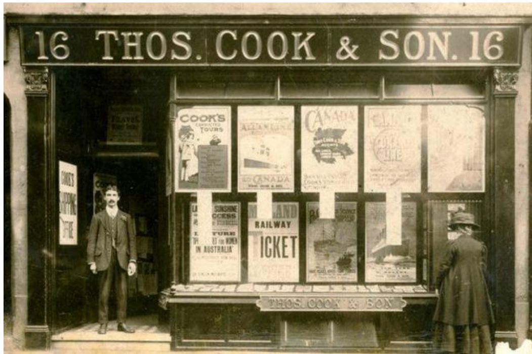
Figura 8 - Thos. Cook & Son, c. 1879. Autoria desconhecida. Fonte: Mirror Online.