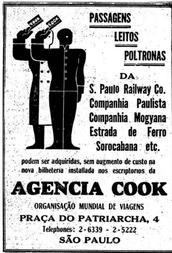
Figura 5 - Anúncio Cook, O Estado de S. Paulo, 09/10/1938.