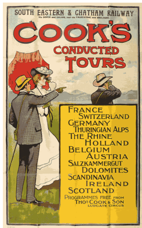
Figura 9 - Cartaz Cook's Conducted Tours.