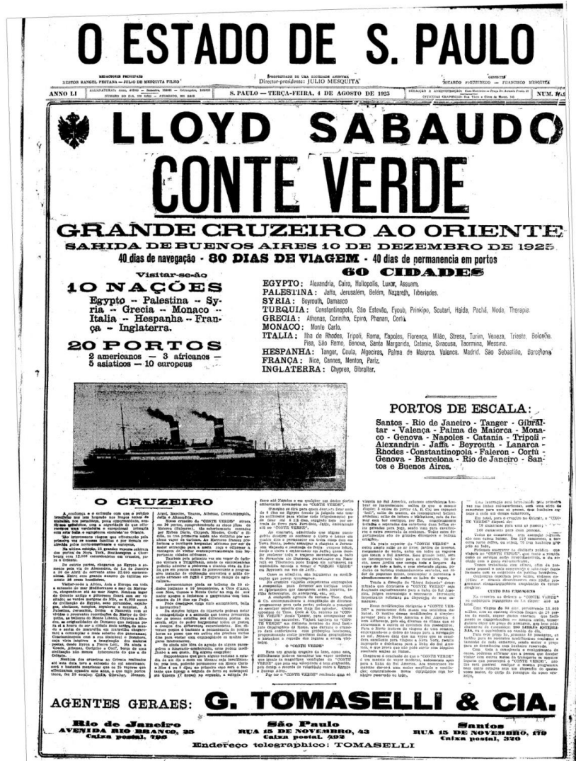
Figura 2 - Anúncio G. Tomaselli & Cia., O Estado de S. Paulo, 04/08/1925.

O cruzeiro contava com o aporte da Cook no fornecimento de programas de viagem específicos para cada porto, além da presença de um guia a bordo desde Tânger, no Marrocos, para acompanhar os turistas nas excursões. Destacam-se os títulos em caixa alta e, no que tange ao conteúdo imagético, o protagonismo da embarcação sobre os destinos percorridos.