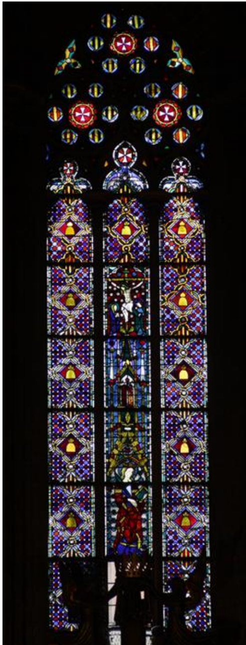
Vitrail de Santa Eulália, 1385.