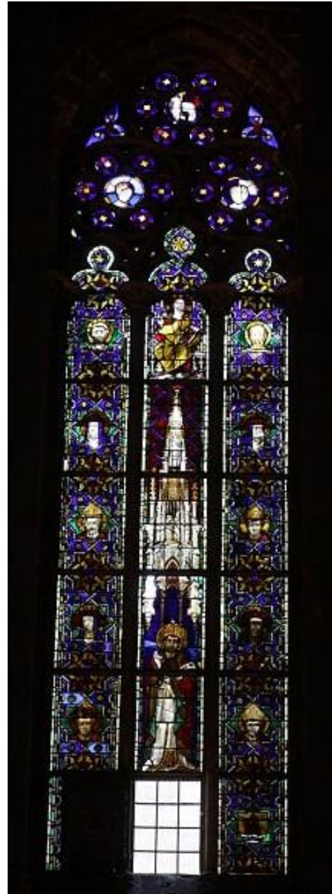
Vitrail de São Silvestre, 1386. Arquivo pessoal, 2018.

Percebe-se, no caso dos vitrais, tanto no corpo da obra quanto em sua localização na Catedral, a hierarquização do espaço tal como ocorre com a distribuição de confrarias nas capelas laterais. Assim, a parte central dos vitrais dedica-se à imagem de um santo,