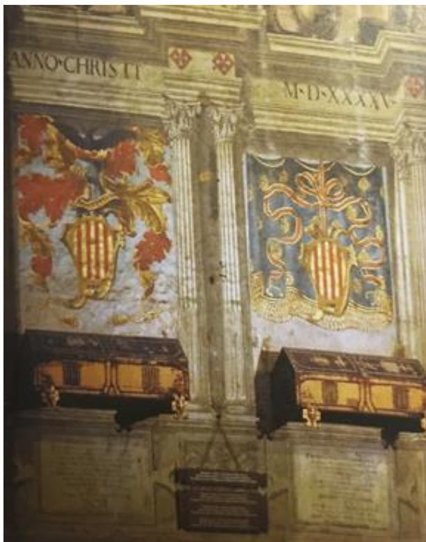
Sepulcros de Ramon Berenguer I e Almodis, condes de Barcelona, 1076, Catedral de Barcelona.