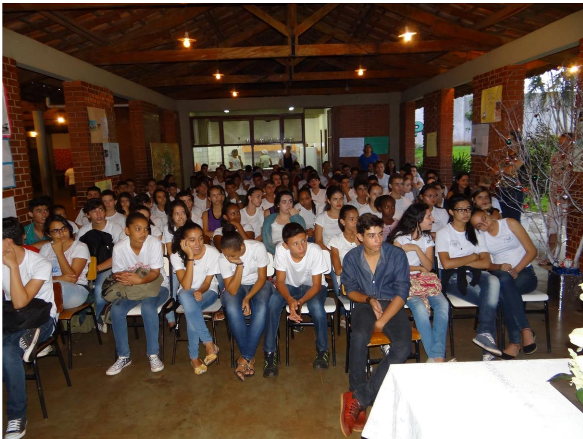
IMAGEM 10- Divulgação do resultado da redação premiada.

Foto do momento da divulgação do resultado do projeto: “Biografias Negras e Redação Premiada”. Itapagipe, 20 nov. de 2015.