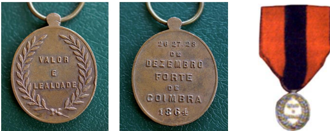
Figura 3: Medalhas à Guarnição que defendeu o Forte de Coimbra, nos dias 26, 27 e 28 de Dezembro de 1864.