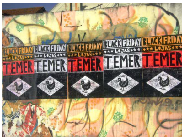
Figura 3– Black Friday Lojas Temer

símbolo da Federação das Indústrias do Estado de São Paulo (FIESP), e acentua bem a dobradinha política pública e negócios, reforçando o empenho com que os empresários participaram na campanha a favor do impeachment, e todos os seus desdobramentos. Do ponto de vista artístico, a técnica utilizada para produzir o trabalho foi em xilogravura (gravura sobre madeira), o que confere uma qualidade ao conjunto da imagem. O objetivo do artista foi de fato, denunciar e trazer questões contundentes da nossa vida política e social, com uma dose de humor, mas sem perder o fio condutor de um trabalho de arte. Não se trata de mera reprodução para colagem indiscriminada pela cidade, mas oferecer uma qualidade visual que instiga o olhar do observador e apresenta novas possibilidades de se comunicar no espaço urbano.