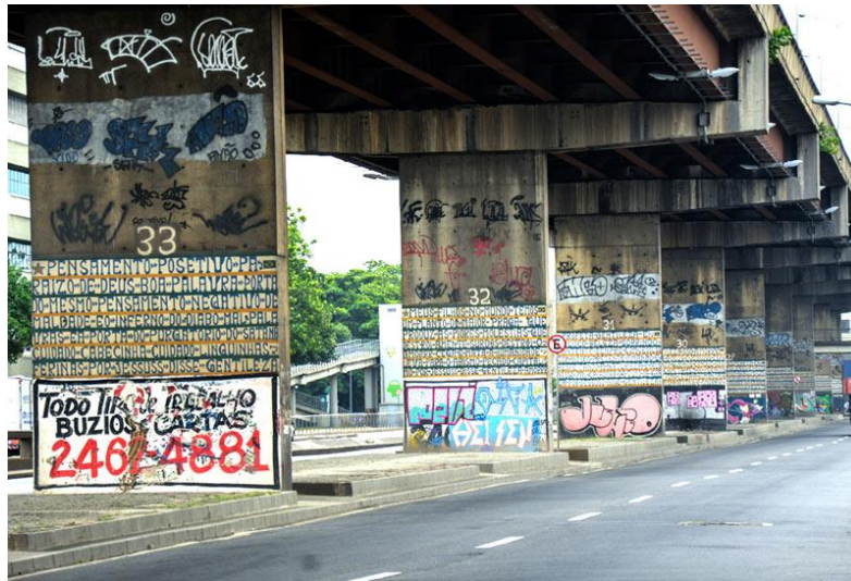
Figura 2– Profeta Gentileza