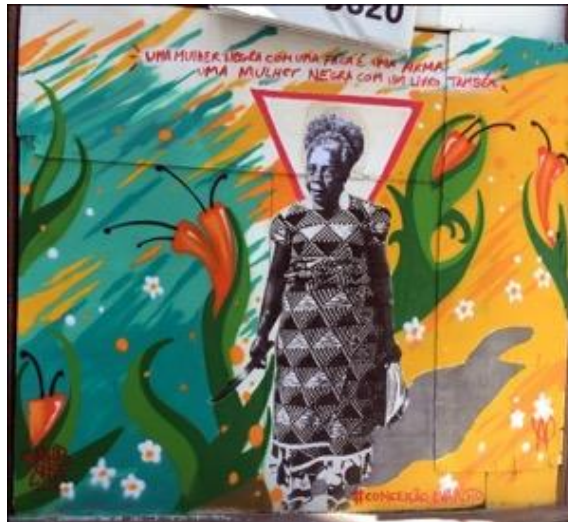
Figura 4 - Grafite "Uma mulher negra com uma faca é uma arma, uma mulher negra com um livro também" – Rua do Carmo- Centro RJ

dos afrodescendentes, reconhecida nacionalmente e internacionalmente, já que muitos de seus livros já foram traduzidos e publicados em francês e inglês. Conceição Evaristo no seu poema Certidão de Óbito a seguir, além de fazer um resgate da memória, ela entrelaça passado e presente no mesmo lugar de opressão e violência.