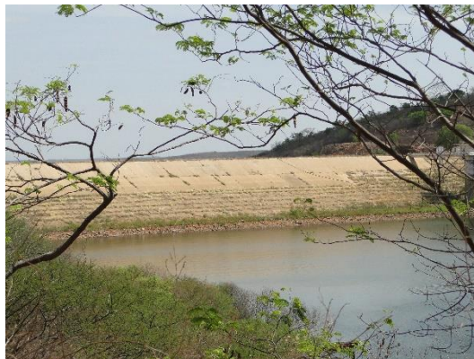
Barragem Engenheiro Ávidos, Boqueirão de Piranhas, Distrito de Boqueirão, Município de Cajazeiras, PB. Dez. 2019.

A bacia de Piranhas está localizada no interior do Nordeste brasileiro, iniciando no estado da Paraíba e adentrando as fronteiras do Rio Grande do Norte. Envolvendo especificamente a área dos sertões do Rio Piranhas, esta é composta pelas ribeiras do Rio Piranhas, do Rio do Peixe, do Rio Piancó, Rio Seridó, Rio Espinharas e Ribeira do Rio Sabugi.