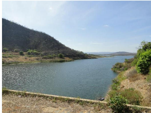
Boqueirão de Piranhas, Barragem Engenheiro Ávidos, Distrito de Boqueirão, Município de Cajazeiras, PB. Dez. 2019.

Foi nesse contexto que o início das obras da barragem de Boqueirão de Piranhas se deu em 1921, inserindo o Rio Piranhas no que ficou conhecido como “programa de construção de grandes barragens” ligadas a ações do governo federal, da época, através da Inspetoria Federal de Obras Contra a Secas (IFOCS), mais tarde Departamento Nacional de Obras contra a Seca (DNOCS).