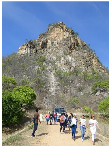
Estudantes do PROEJA, IFPB Campus Cajazeiras, visitando Barragem Engenheiro Ávidos (Boqueirão de Piranhas), Distrito de Boqueirão, Município de Cajazeiras, PB. Dez. 2019.

Foi nesse contexto que o início das obras da barragem de Boqueirão de Piranhas se deu em 1921, inserindo o Rio Piranhas no que ficou conhecido como “programa de construção de grandes barragens” ligadas a ações do governo federal, da época, através da Inspetoria Federal de Obras Contra a Secas (IFOCS), mais tarde Departamento Nacional de Obras contra a Seca (DNOCS).