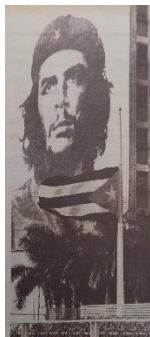
Figura 2 – Che na Plaza de la Revolución

Vermos que essa construção narrativa se repete em outras fotografias presentes na revista, construindo uma narrativa biográfica, a partir da disposição das fotografias, entre as quais um número significativo de retratos.