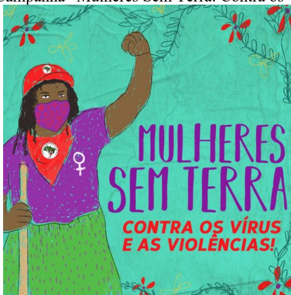
Figura 3 - Arte da Campanha “Mulheres Sem Terra: Contra os vírus e as violências”

o covarde provoca os mesmos sintomas do COVID: ele aprisiona, apavora, sufoca, faz doer a garganta e o corpo - e ambos podem ser letais. Neste momento, nossas panelas precisam soar contra as covas coletivas do vírus, da fome, do feminicídio, da violência doméstica e da ignorância (MST, 2020).