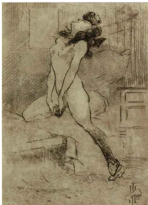
Figura 6: Henrique Alvim Corrêa.

O artista explora a ideia de prazer de modo mais exacerbado em O sapato . Obra em que a figura feminina se masturba com o salto de seu sapato sobre a cama. Seu corpo rígido apoia uma das pernas no colchão e outra no chão deixando a mostra sua meia e o outro sapato que não fora utilizado na ação. Seus cabelos estão presos de modo informal com um laço. Sua face está voltada para cima com os olhos fechados como se estivesse imersa em seu próprio universo de prazer que ela mesma lhe provoca. É a representação da autonomia do prazer feminino.