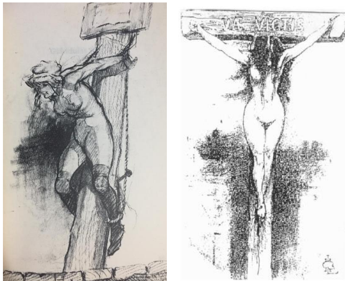
Figura 4: Henrique Alvim Corrêa. Nu – tema alegórico (Reproduzido em SCHMALTZ, Yêda. Baco e Anas brasileiras . Rio de Janeiro: Achiamé, 1985, p 61)

Iconografia que foi utilizada pelo artista em outras obras nas quais a mulher também aparece amarrada a um tronco, como na Imagem 4 em que a figura feminina agora não só está amarrada, como foi pendurada pelas costas. É possível perceber a figura feminina amarrada pelos pés e pelas pernas de modo que seu corpo e rosto estão voltados para baixo. Ela está nua, no entanto, assim como na obra anterior vestindo meias pretas, sapatos e uma espécie de chapéu em sua cabeça.