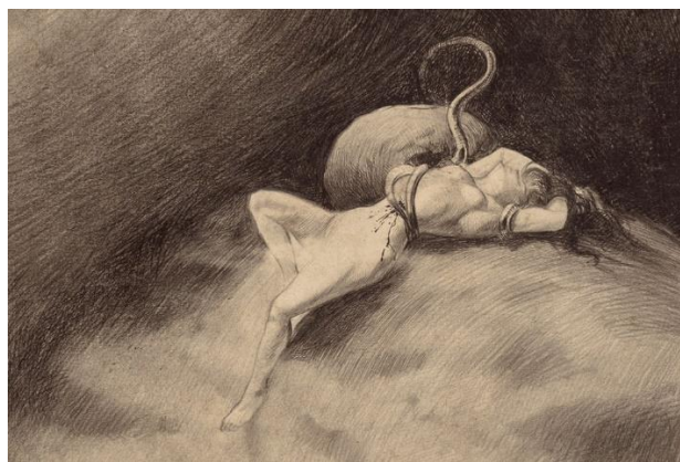
Figura 13: Henrique Alvim Corrêa. Sem título e data. Crayon e bico de pena sobre papel.