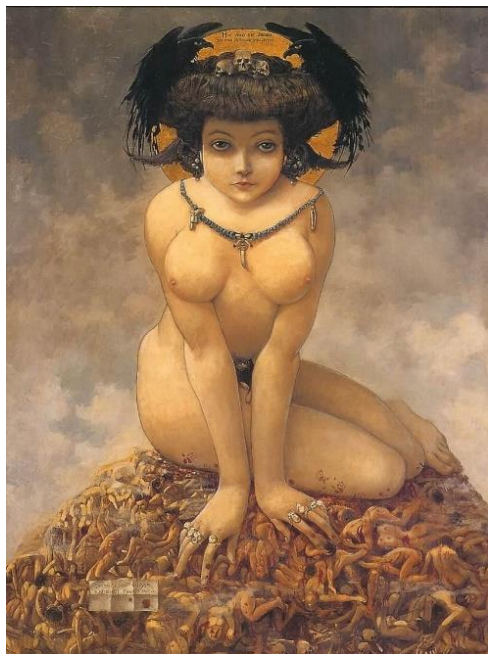
Figura 12: Gustav Adolf Mossa. Elle, 1906.

Em Elle uma gigantesca figura feminina impera sobre uma pilha de corpos masculinos ensanguentados. Essa figura apresenta um rosto infantil de grandes olhos e traços delicados o que contrasta com seu corpo voluptuoso de seios fartos que se destacam. Um pequenino gato preto aparece à frente de seu sexo de modo que o esconde. Coli observa que na obra de Mossa Elle “é a única triunfadora nas chacinas, políticas ou carnais.” (COLI, 2010)