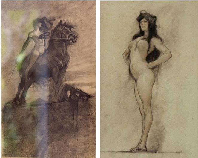
Figura 9: Alvim Corrêa. Sereia vitoriosa. (Reproduzido em SCHMALTZ, Yêda. Baco e Anas brasileiras . Rio de Janeiro: Achiamé, 1985, p 44)

outra, a mulher surge como um elemento perigoso, misterioso. (COSTA JUNIOR, 2010, p.363)