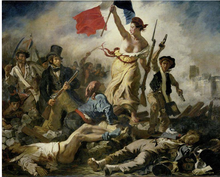
Figura 11: Eugène Delacroix. Liberdade guiando o povo, 1830.

Delacroix. Dessa figura que representa a Liberdade que luta junto dos de seus defensores, pega em armas assim como Sereia Vitosa e do mesmo modo, ambas as obras apresentam corpos masculinos mortos ao chão. Para ambas figuras femininas não são representadas durante a batalha ou lutando, elas já venceram. Não aparece a possibilidade de perda, elas simplesmente imperam.