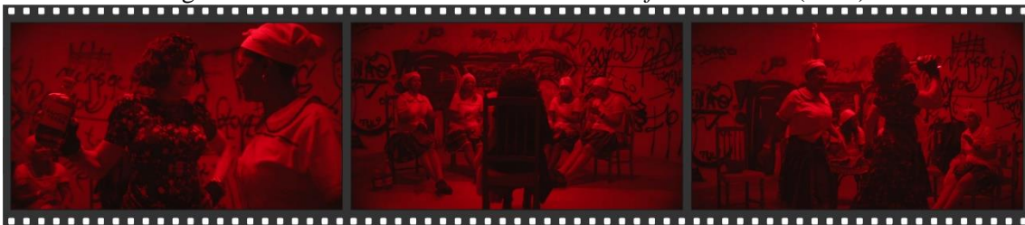
Figura 04: Frames do documentário “ World of Madame X ” (2019).