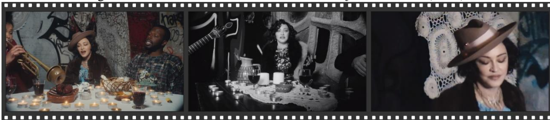
Figura 03: Frames do documentário “ World of Madame X ” (2019).