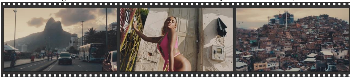
Figura 05: Frames do documentário “ World of Madame X ” (2019).