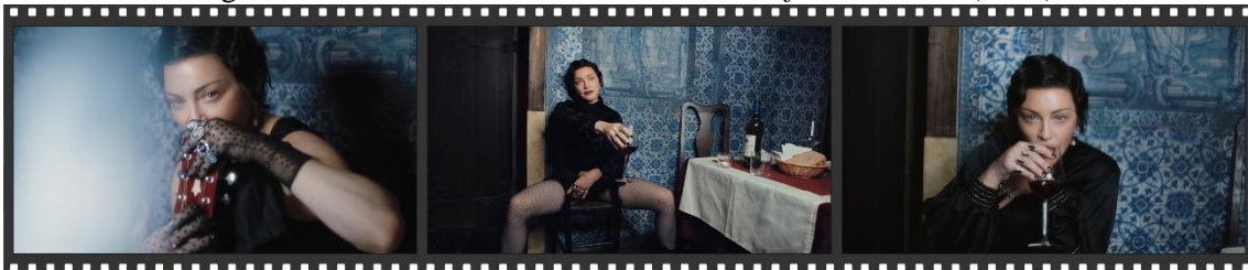
Figura 02: Frames do documentário “World of Madame X” (2019).

Fonte: Recorte dos autores. Eagle Rock Entertainment e Interscope Films, 2019.