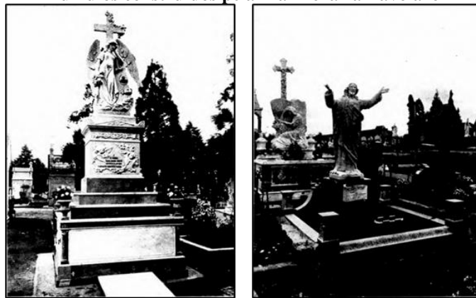
Túmulos construídos pela Marmoraria Tavolaro