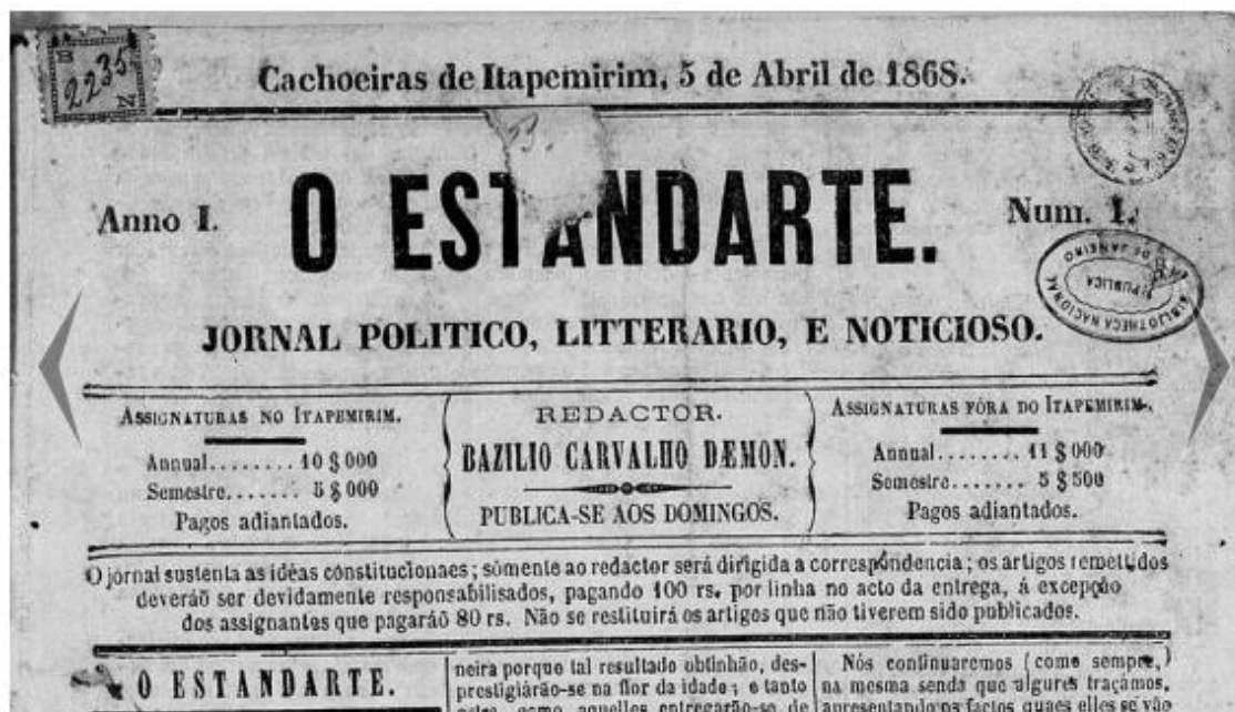
Figura 01: Fragmento da primeira página do O Estandarte (1ª edição).

O texto intitulado “Os ciganos-história, língua e costumes” foi publicado em três edições do periódico analisado: 03 de fevereiro de 1871, 10 de dezembro de 1871 e 17 de dezembro de 1871. Dotado de um forte cunho literário, elemento recorrente na incipiente imprensa brasileira do final do século XIX, trata-se de um artigo francês que foi traduzido e respectivamente replicado no impresso.