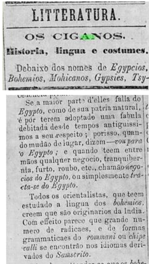
Figuras 02 e 03: Fragmentos do jornal O Estandarte (1871)

Ao longo de todo o artigo, nos é possível verificar as diversas denominações dadas aos povos ciganos como anteriormente discutidas neste artigo, como também possíveis origens e comportamentos e vícios esperados desta minoria étnica. A história dos ciganos trata-se de um dos principais temas do ensaio com um claro viés eugenista. Além disso, percebemos as classificações que organizam o cigano no meio social ao longo do texto: além das diversas designações imputadas a eles ao longo dos séculos, o personagem errante, a sua origem incerta, o nomadismo, a vadiagem e as práticas de feitiçaria atribuída a mulher cigana encontram-se presentes ao longo do texto.