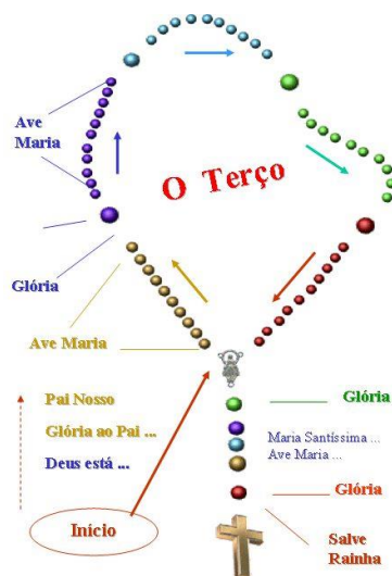
Figura 2: O Terço do Divino Espírito Santo, cantado à moda da Ilha Terceira dos Açores.

A entonação vai ganhando força na medida em que mais gente vai entrando na reza. Mesmo no formato virtual, o ato de seguir vai desenhando um cenário coletivo de esforços, de perseverança e de apego ao sagrado. Os sentidos dados aos símbolos e aos significados que a reza tem extrapola sentimentos de graça, de fé e de gratidão ao Espírito Santo ao longo da jornada. Num ano de muitas perdas de familiares e amigos, os sentimentos se afloram e cada vez mais se busca na religião os sentidos da continuidade e da manutenção da fé.