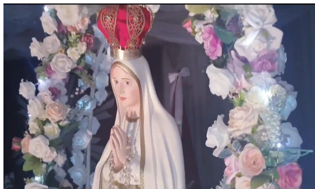
Figura 4: Imagem de Nossa Senhora de Fátima nas rezas virtuais

Após a coroação das sete crianças que simbolizam os dons do Espírito Santo, a coroação de Nossa Senhora fecha o ciclo do ano para o recomeço do próximo. É o símbolo maior de devoção e de continuidade das ações e por isso se exalta em todas as manifestações de fé, na própria Casa dos Açores, na procissão e finalmente no ato final da coroação.