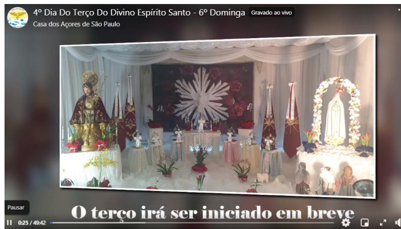
Figura 1: A chamada para o terço virtual – Casa dos Açores, 2021.